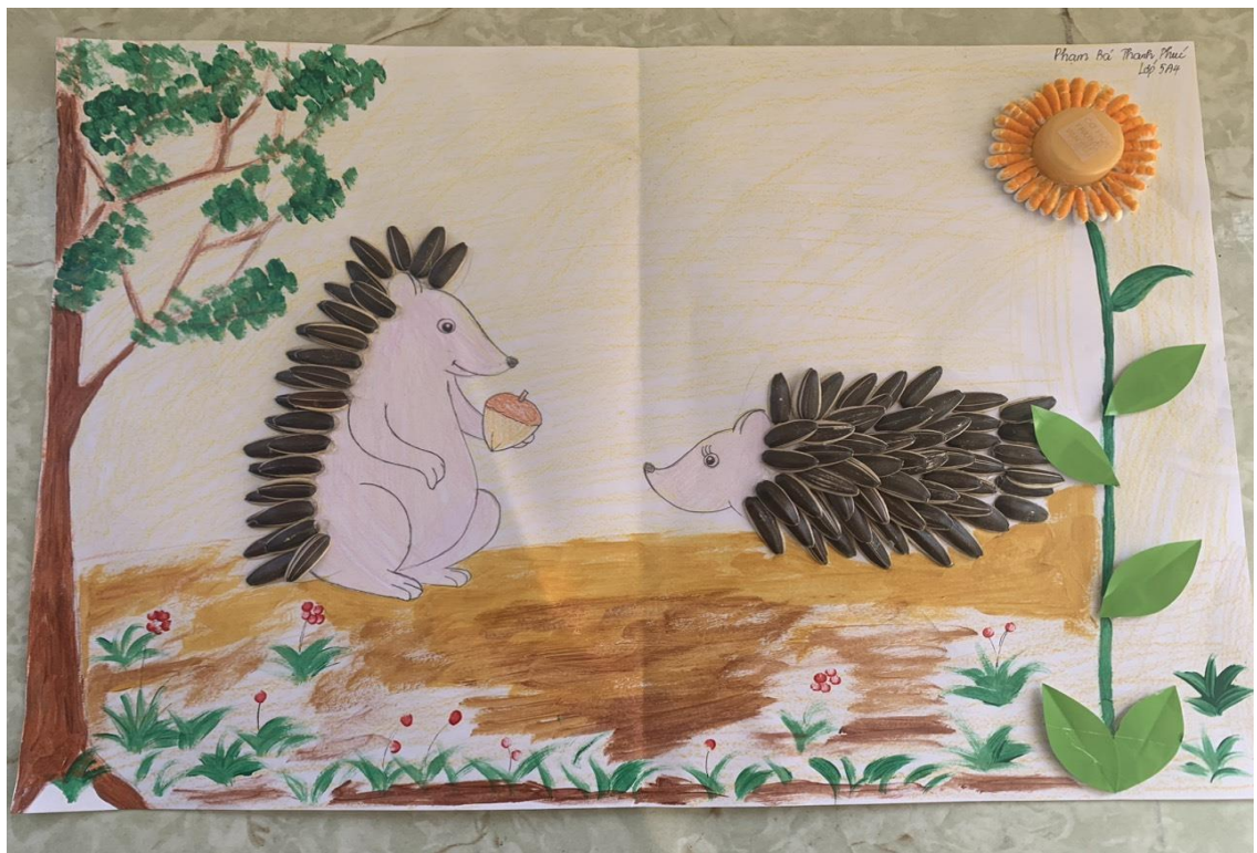
Sản phẩm được làm từ vỏ hạt hướng dương, bông tăm