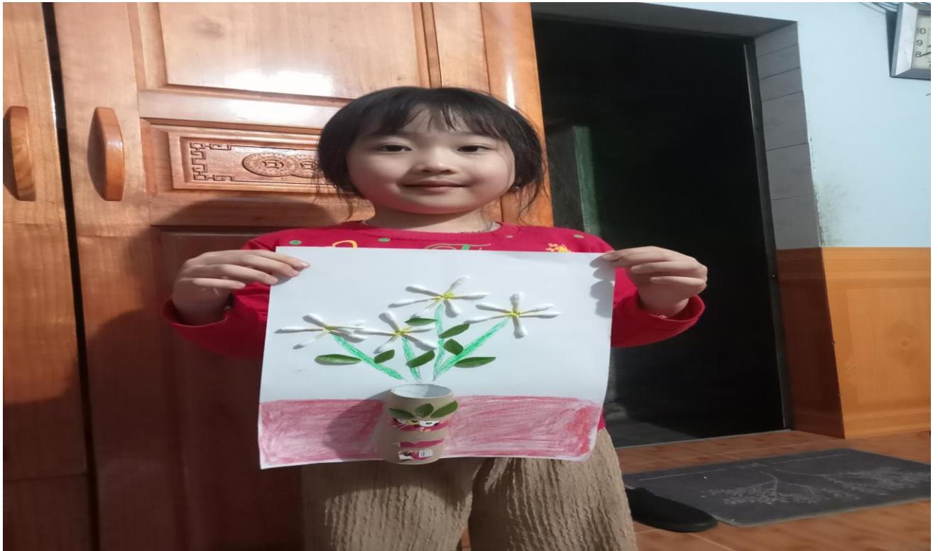
Sản phẩm được tạo ra từ vỏ hộp giấy