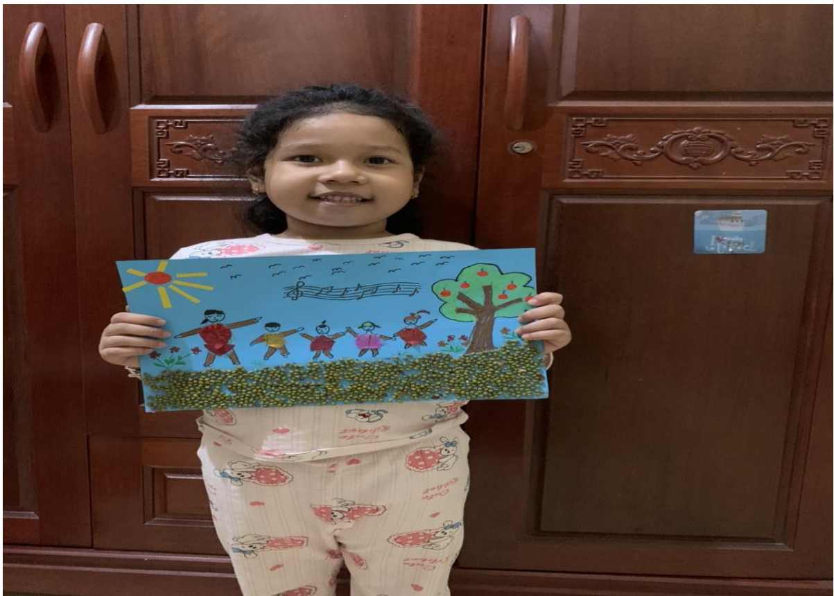
Sản phẩm được tạo ra từ vỏ đỗ, ống mút, cánh hoa