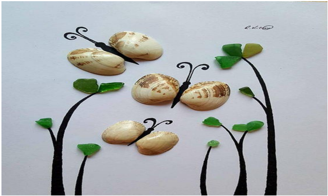
Sản phẩm được làm từ vỏ ngao