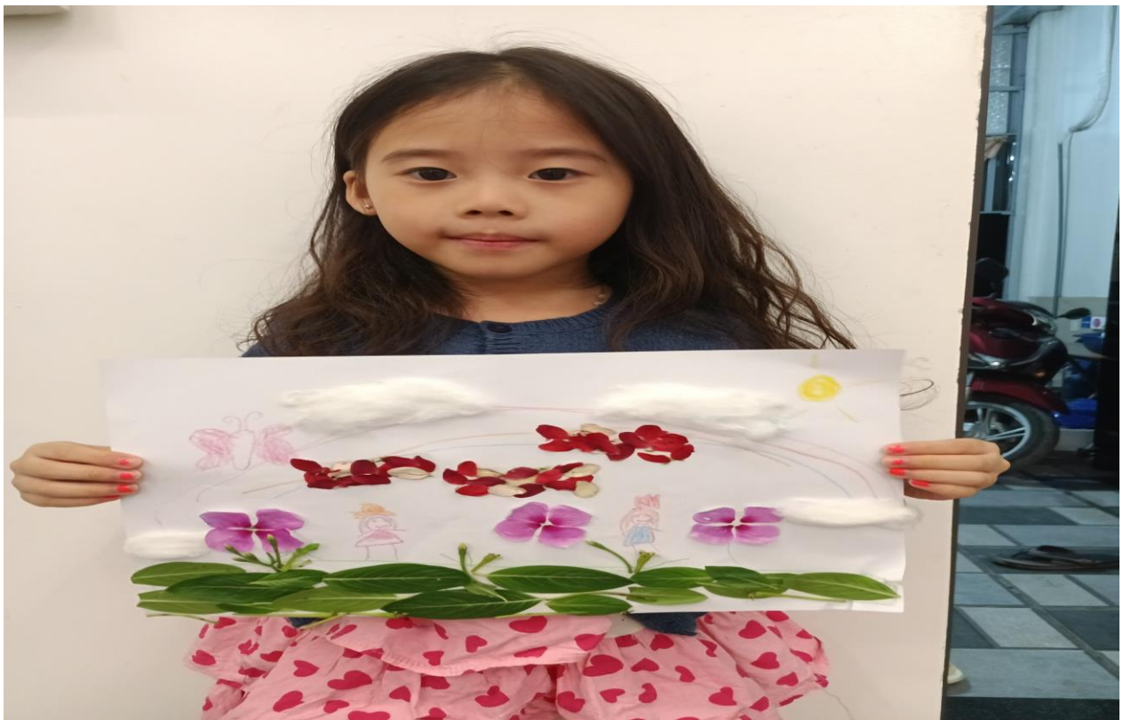
Sản phẩm được làm từ lá cây, hoa khô