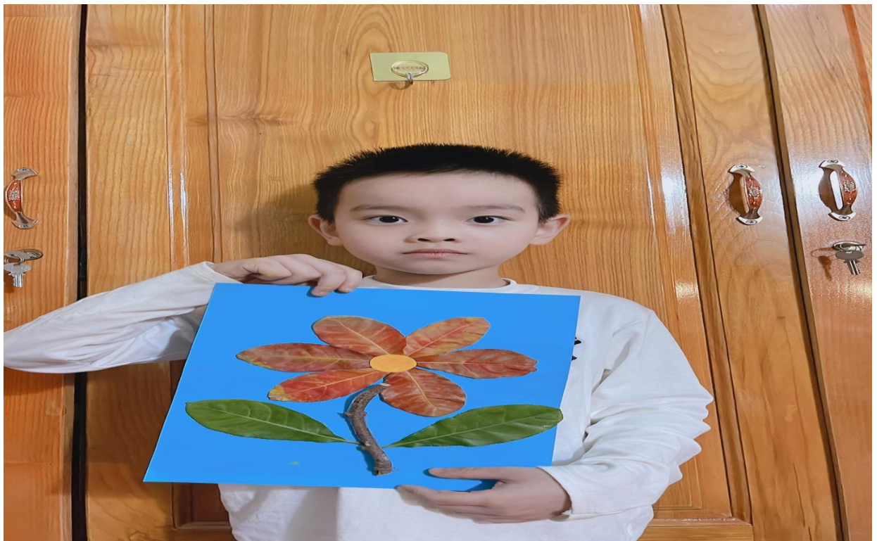
Sản phẩm được làm từ lá cây, cành cây