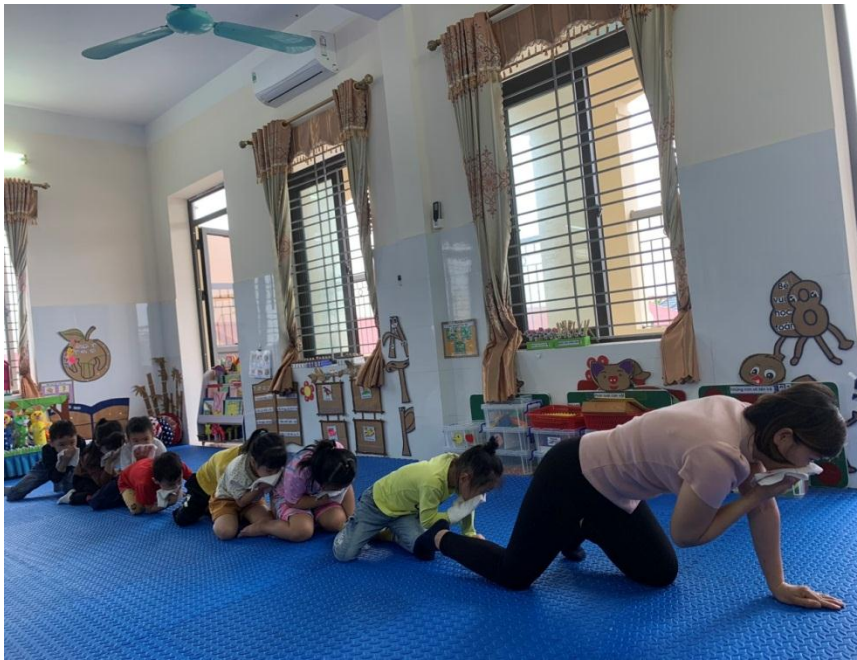
Dạy trẻ cách dùng khăn ẩm che lên miệng và mũi, bò nhanh thoát khỏi đám cháy