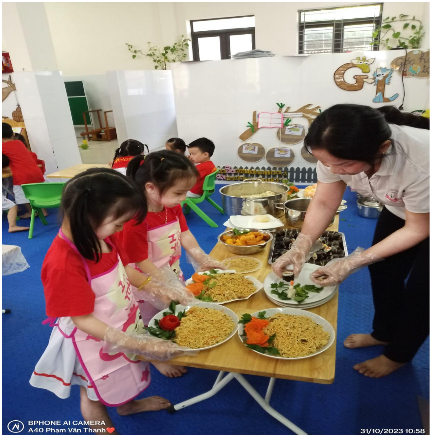
Cô giáo đang hướng dẫn các bé bày thức ăn và trang trí sao cho đẹp và ngon mắt.