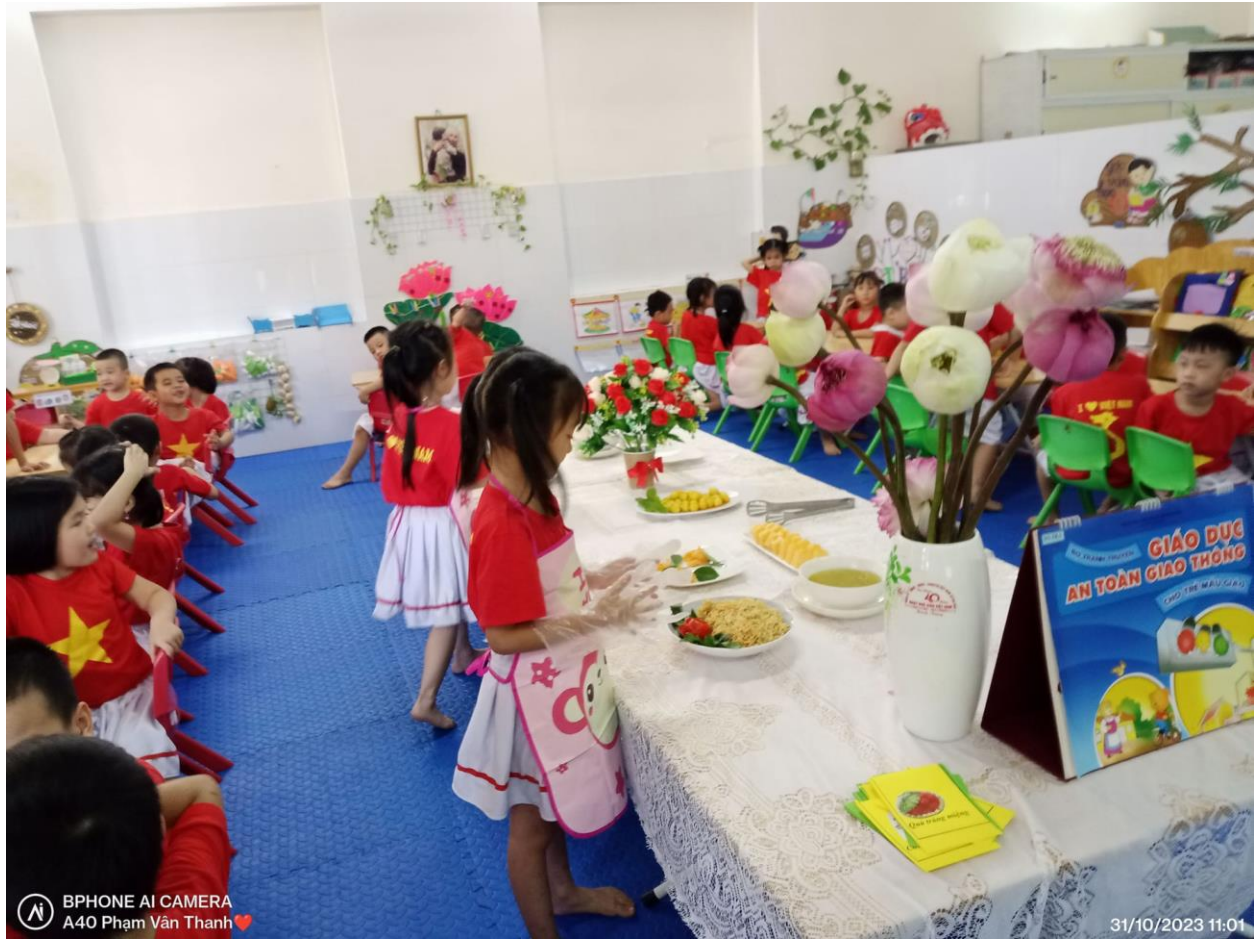
Các bé nhanh nhẹn giúp cô chuyển những đĩa thức ăn bày ra bàn tiệc.