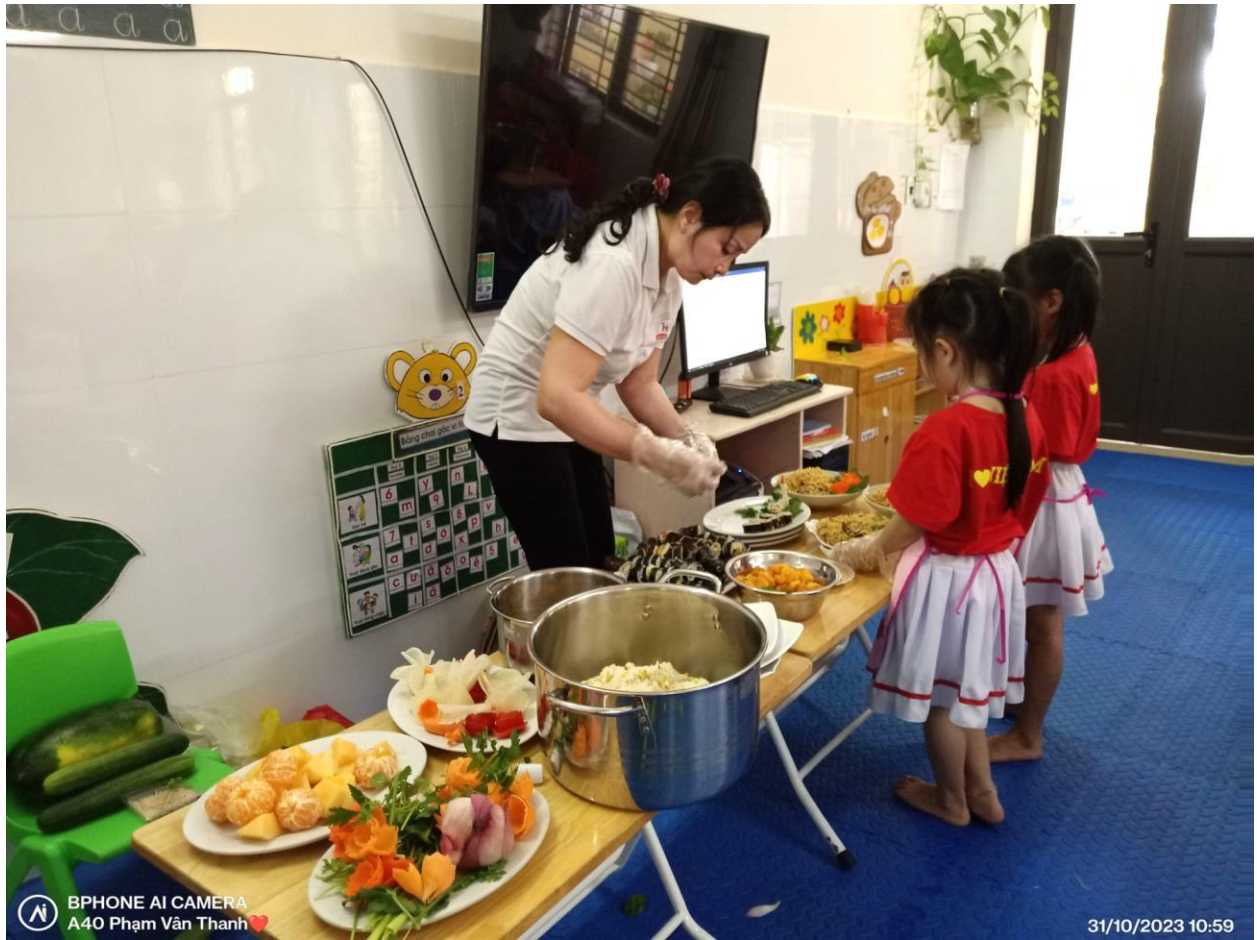
Đồ ăn đã được chuyển lên lớp, các bé trực nhật đang cùng cô bày thức ăn ra đĩa.