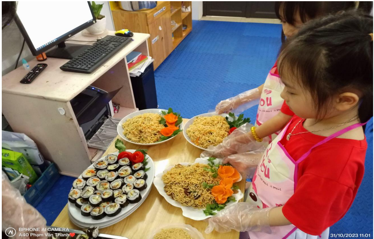
Những đĩa thức ăn đang được bày ra thật hấp dẫn.