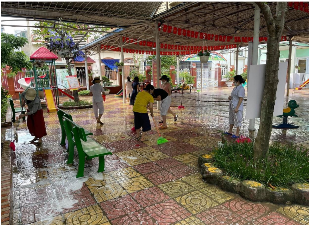
Cọ rửa sân trường