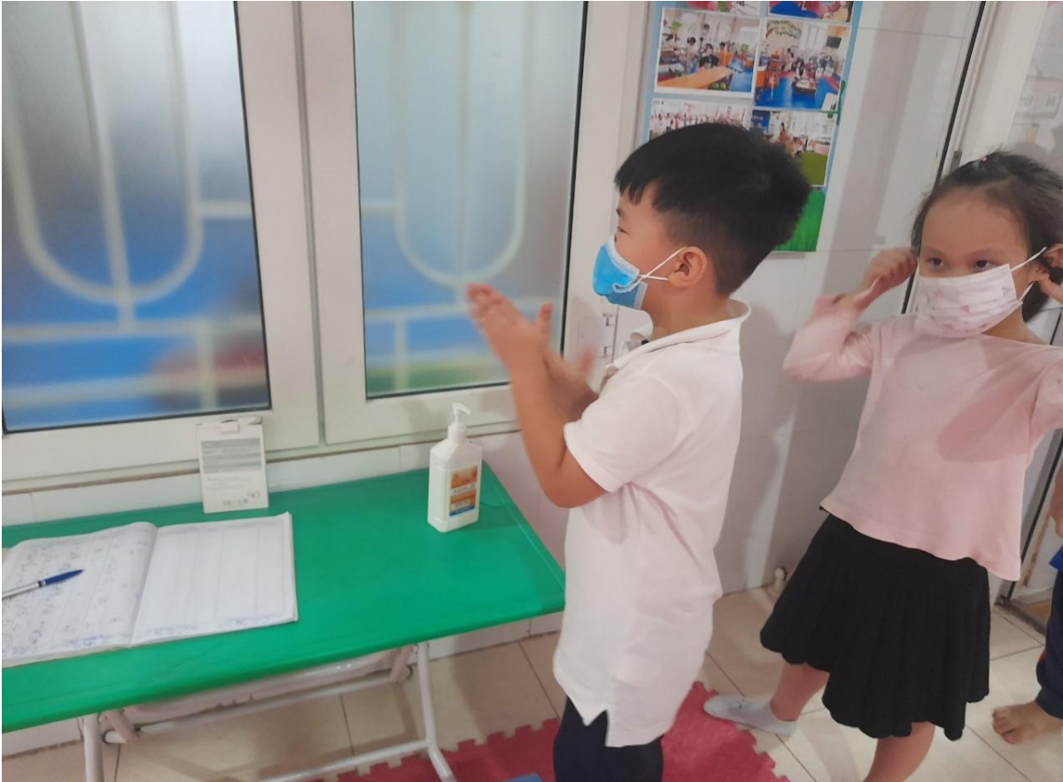
Rửa tay bằng nước sát khuẩn