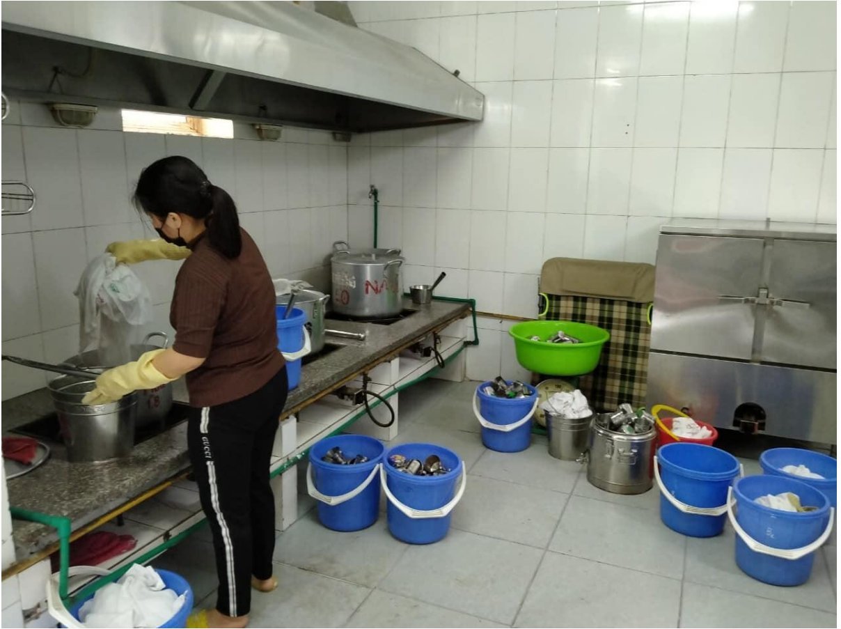
Vệ sinh lược ca, lược khăn cá nhân của trẻ.