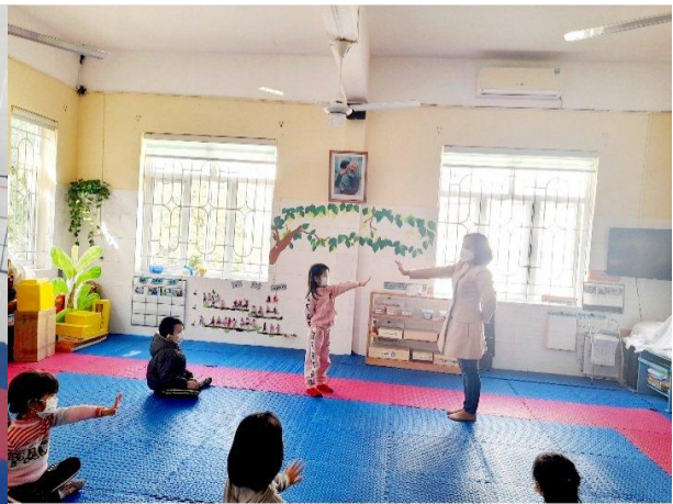
Giữ khoảng cách 2 m