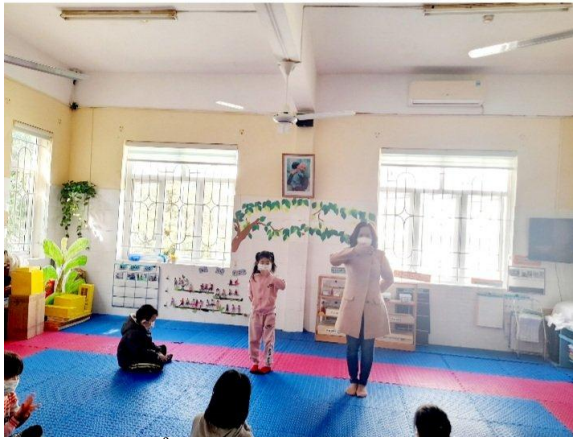
Đeo khẩu trang

Giải pháp 1: Hướng dẫn trẻ 5 tuổi một số kĩ năng cơ bản về phòng chống dịch bệnh covid- 19 khi các con đến trường.