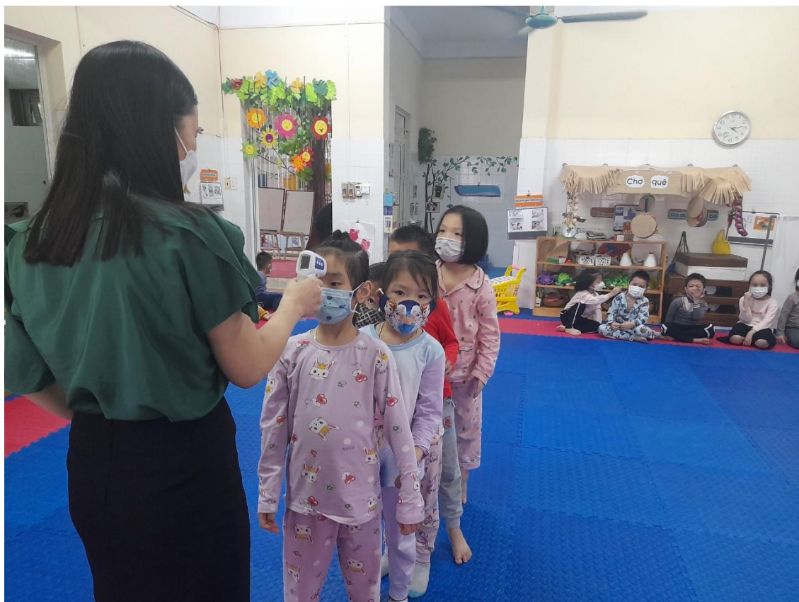
Đo thân nhiệt của trẻ trước giờ đón