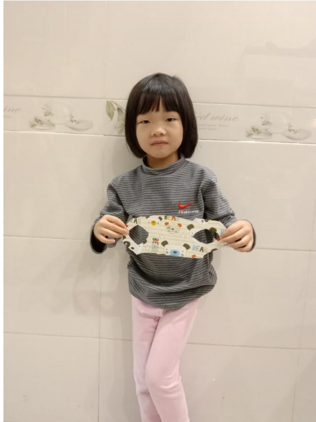
Sản phẩm khẩu trang của bé Minh Hà