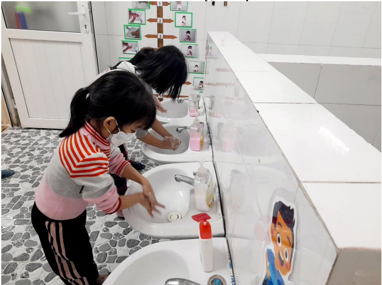
Trẻ rửa tay bằng xà phòng