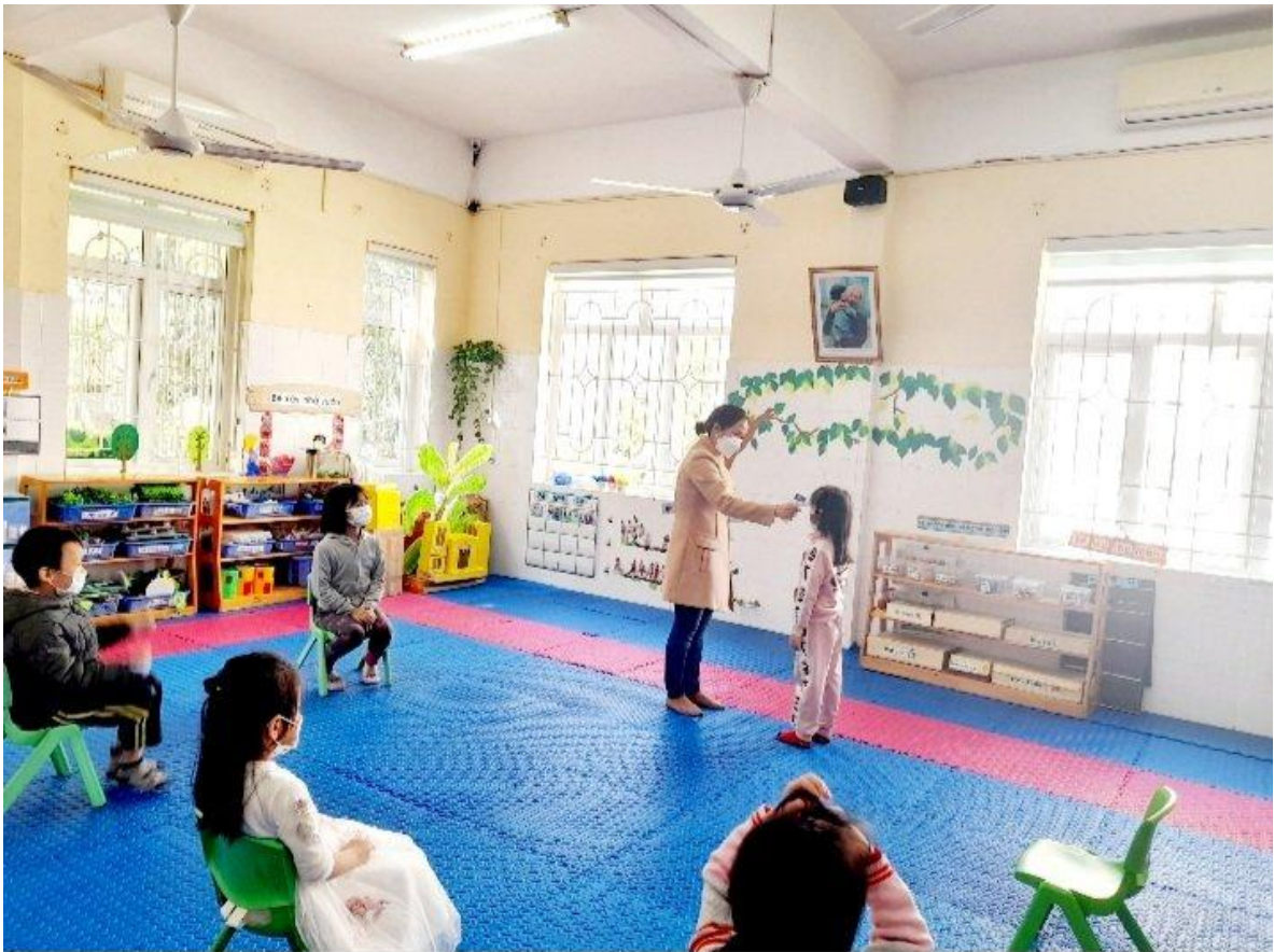
Cô giáo đo thân nhiệt cho các cháu hàng ngày.