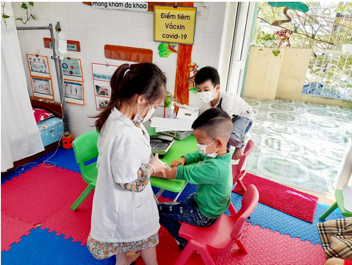
Trẻ chơi tiêm phòng và dạy bạn cách phòng chống dịch bệnh