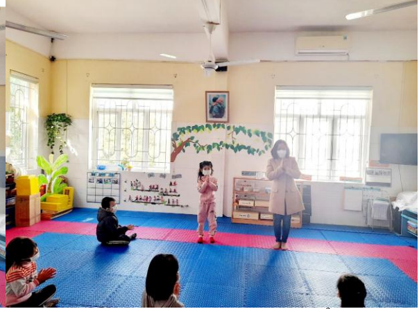
Khử khuẩn tay