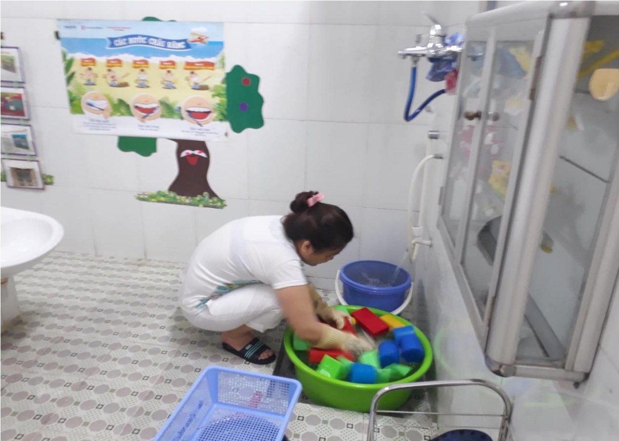
Vệ sinh đồ dùng, đồ chơi của trẻ.