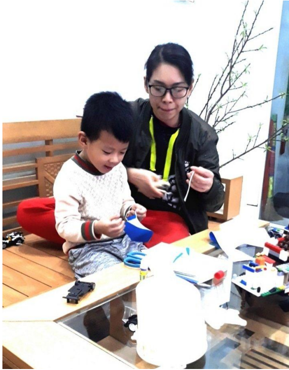
Sản phẩm khâu trang của bé Nhật Thành