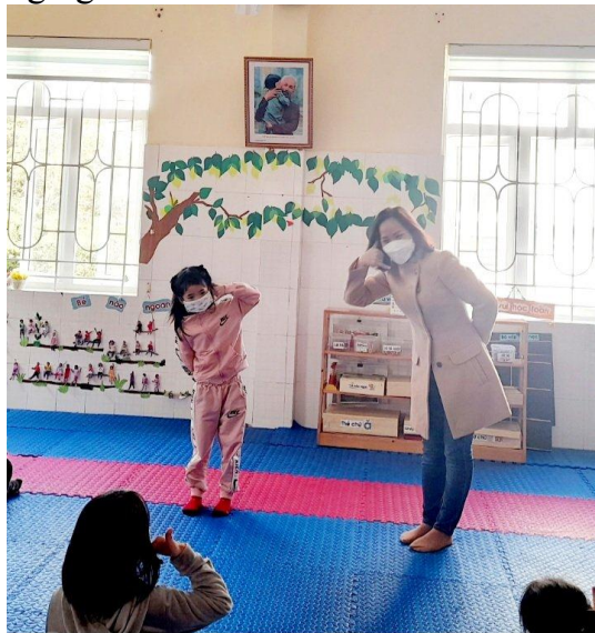
Gọi điện báo y tế