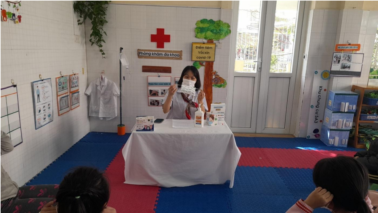
Phụ huynh phối hợp với cô giáo dạy trẻ kỹ năng đeo khẩu trang phòng chống dịch bệnh covid-19