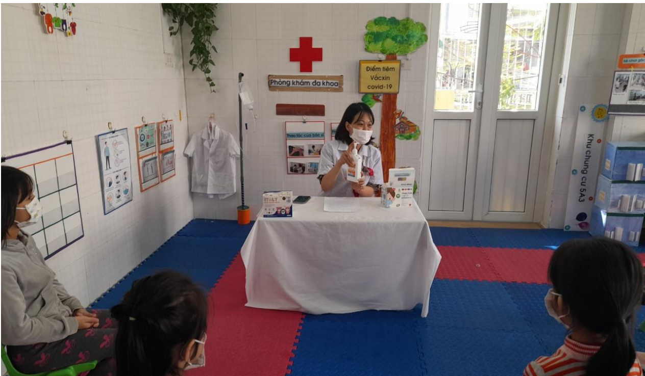
Phụ huynh phối hợp với cô giáo dạy trẻ kỹ khử khuẩn tay phòng chống dịch bệnh covid-19