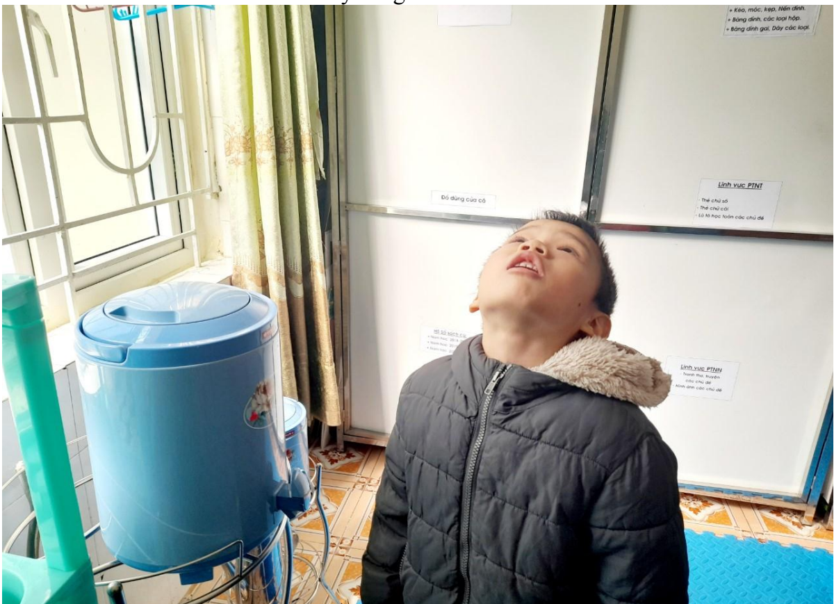
Xúc miệng nước muối hàng ngày