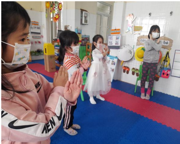
Không tập trung đông người