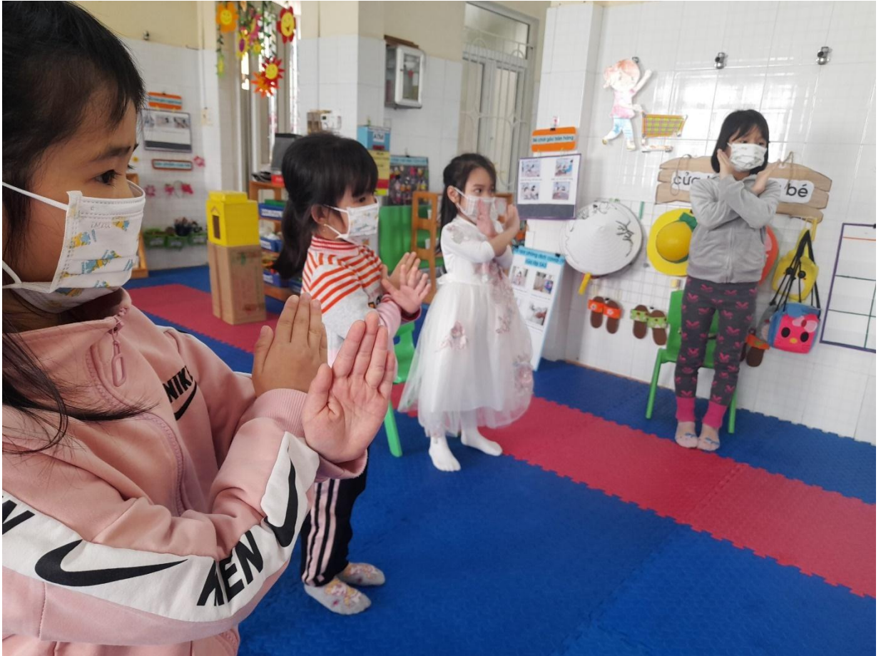
Trẻ thực hành các quy định 5K phòng chống covid- 19