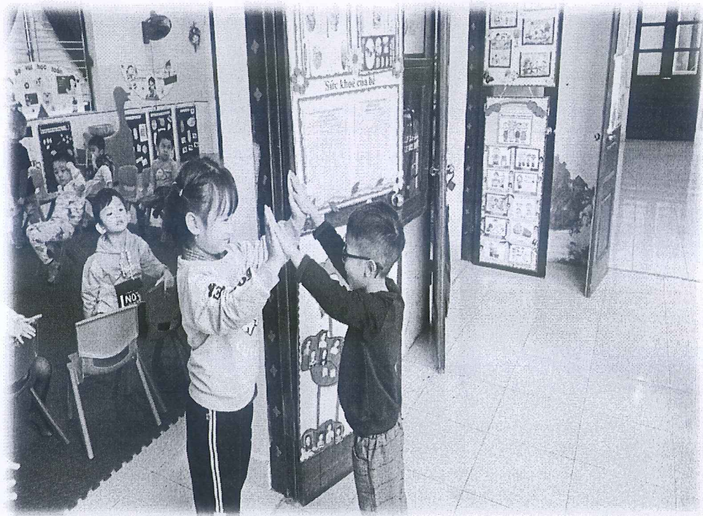
Phụ lục 2: Trẻ thể hiện lời chào bằng hành động