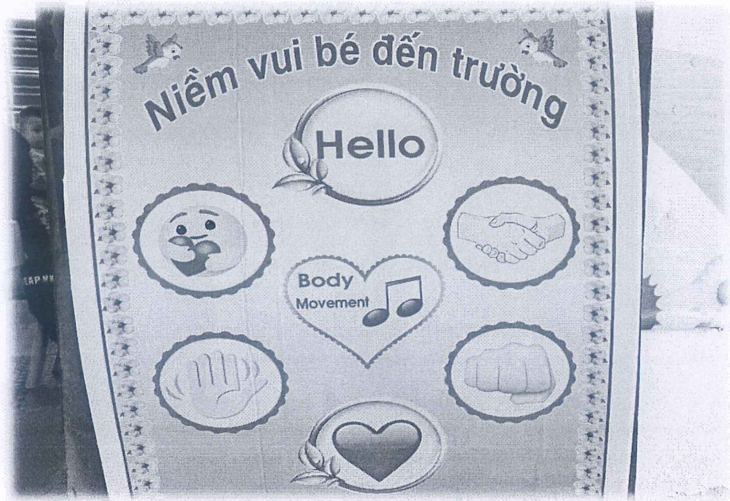
Phụ lục 1: Bảng thể hiện cảm xúc thay cho lời nói

* Một số hình ảnh trong hoạt động rèn kỹ năng chào hỏi lễ phép với người lớn cho trẻ: