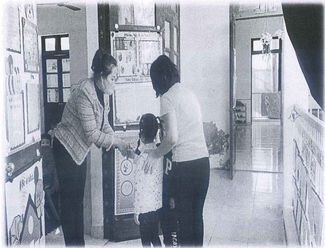
Phụ lục 9: Trẻ thể hiện hành động thay cho lời chào