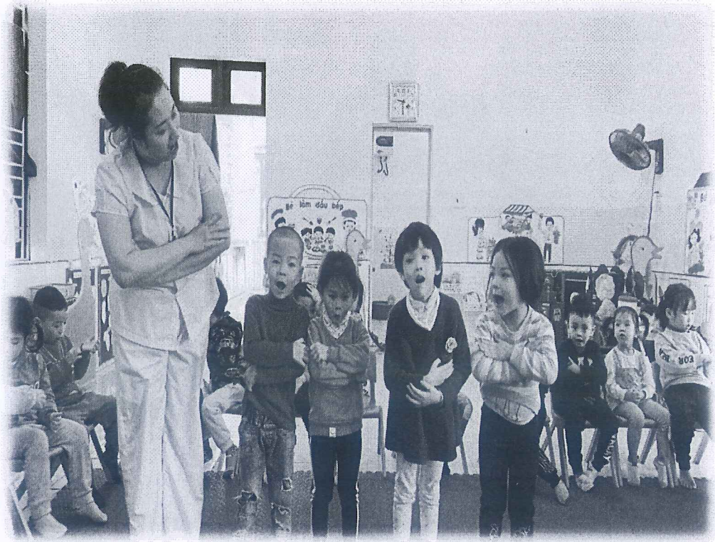
Phụ lục 5: Cô dạy trẻ cách chào hỏi lễ phép