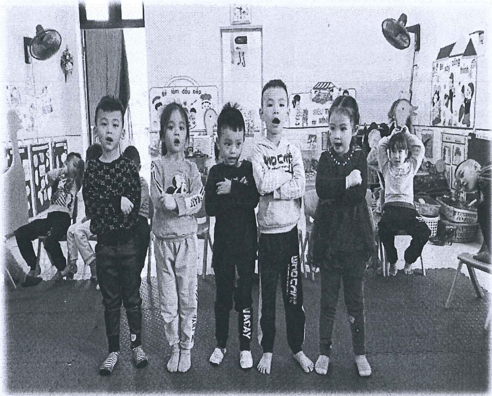
Phụ lục 4: Dạy trẻ chào hỏi trong giờ hoạt động chiều