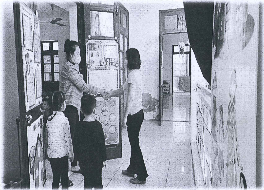
Phụ lục 8: Giáo viên và phụ huynh làm mẫu hướng dẫn trẻ