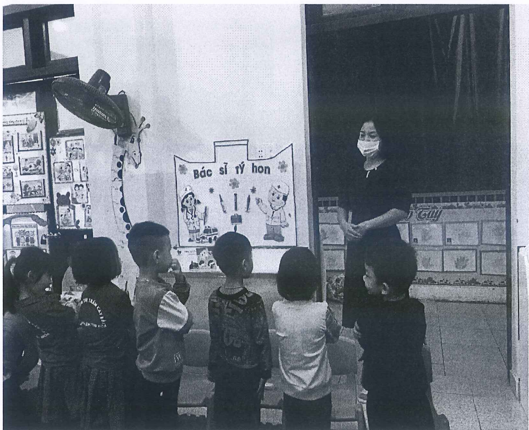
Phụ lục 6: Trẻ chào hỏi khi có khách đến nhà