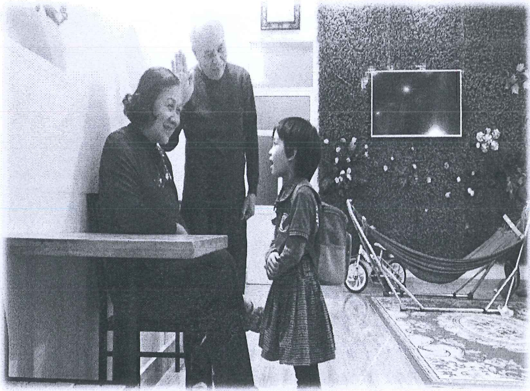
Phụ lục 7: Trẻ đi học về lễ phép chào ông bà