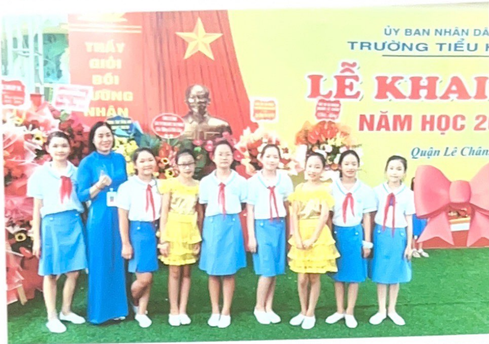
Khai giảng năm học 2023 -2024