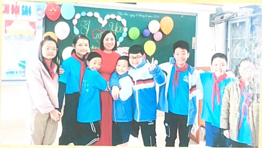
Kỉ niệm ngày 20-11 năm cuối cấp bậc Tiểu học của em bên cô và các bạn.