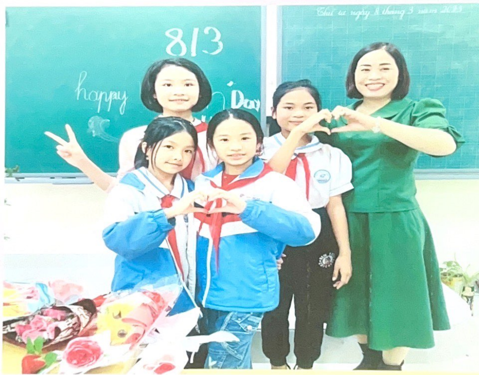
Cô rạng ngời bên chúng em vui ngày 8/3.