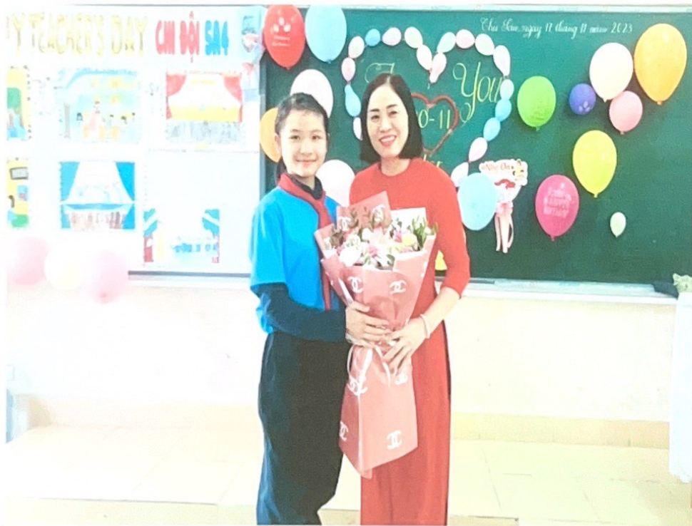
Kỉ niệm ngày 20/11 bên cô và các bạn.