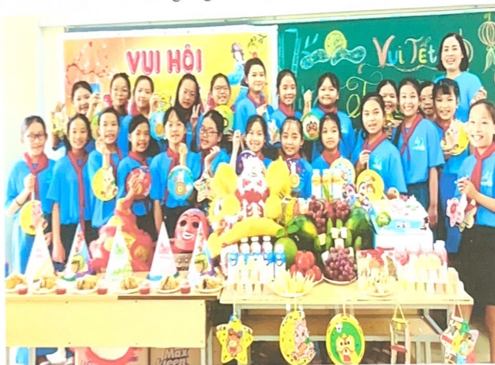
Trung thu năm 2023 lớp em thật tuyệt!