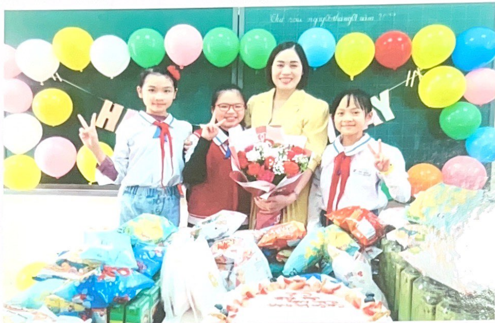
Sinh nhật cô mà em hào hứng như sinh nhật mình.