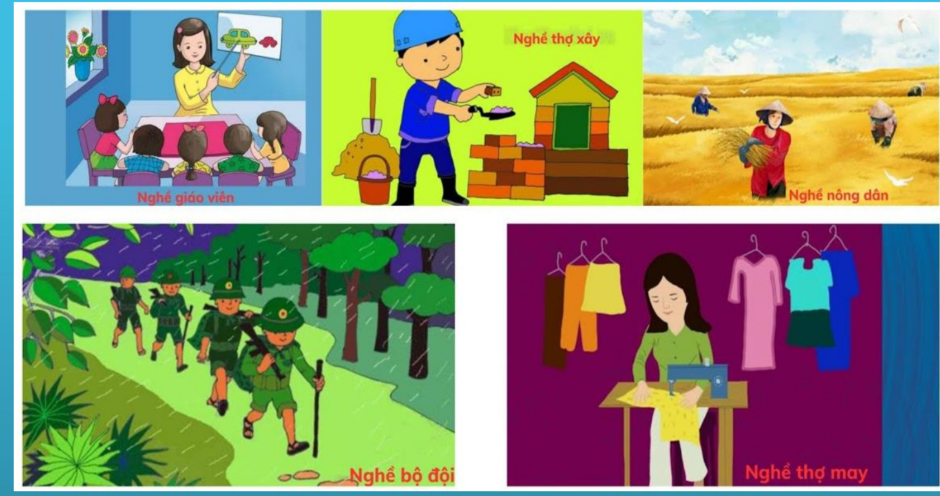
Nhánh 2: Nghề phổ biến