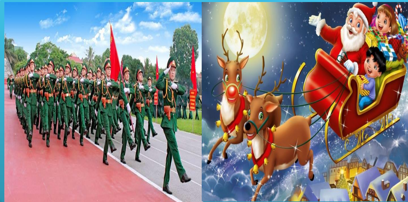
Nhánh 3: Chú bộ đội - vui đón Noel