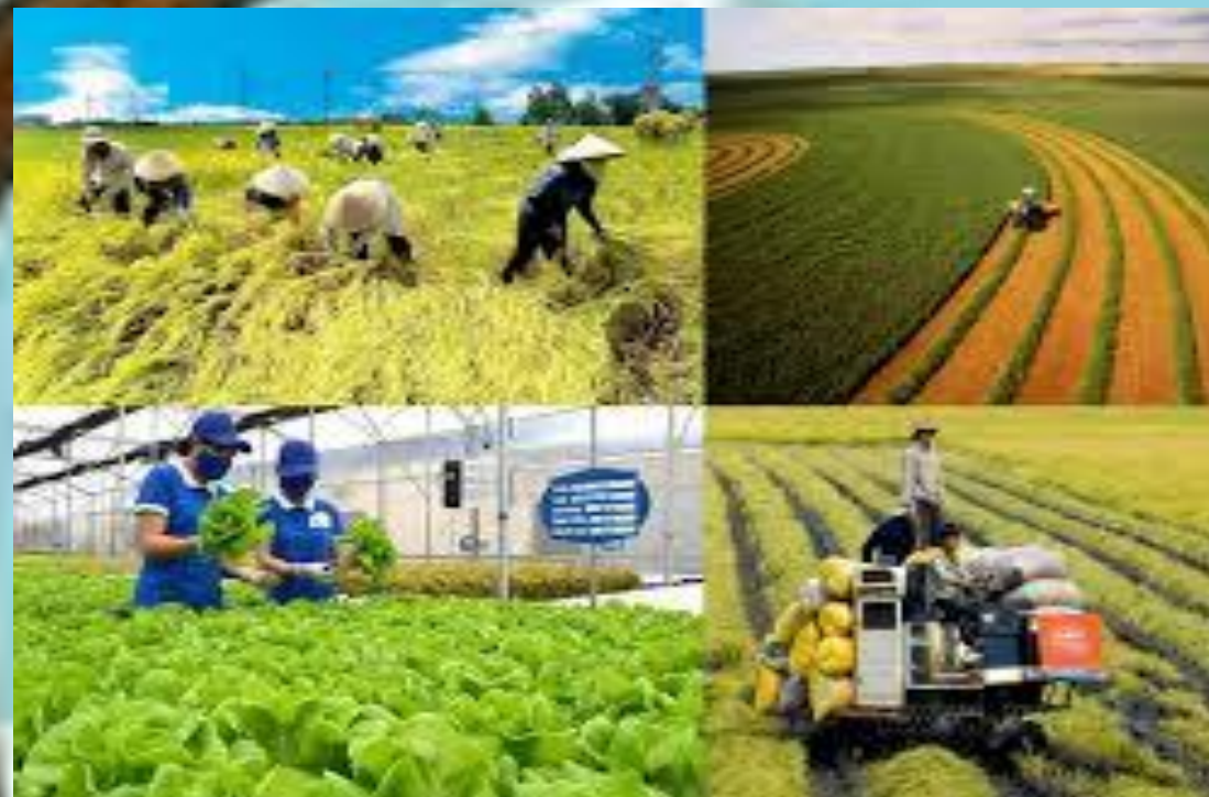
Nhánh 1: Nghề nông (2T- Từ 25/11 đến 06/12/2024)

Thời gian thực hiện: 5 tuần. Từ 25/11 đến 27/12/2024