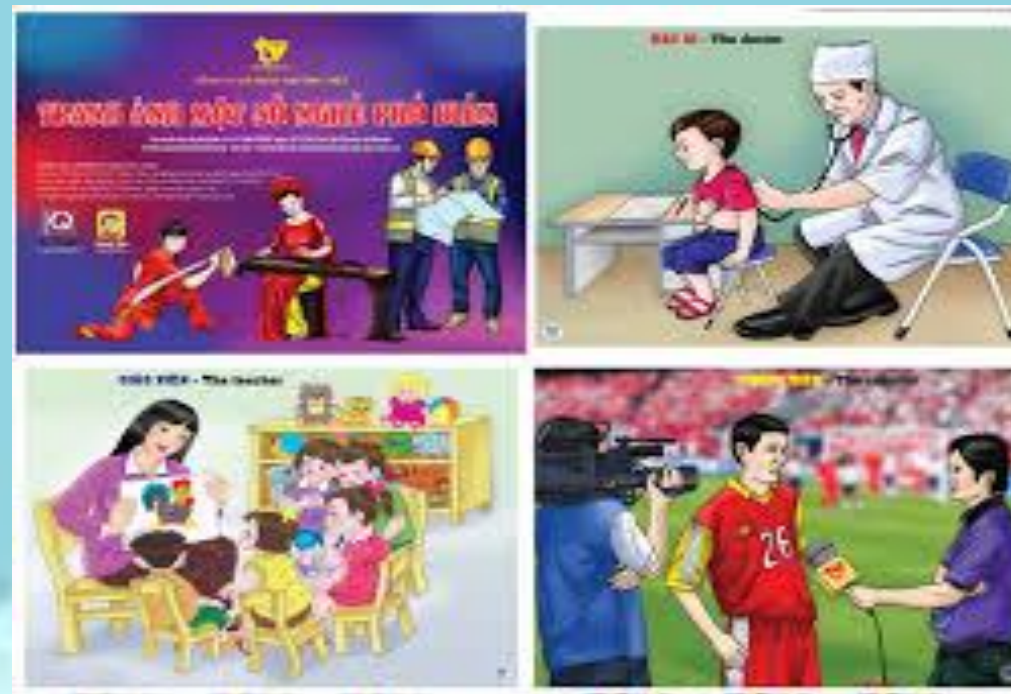
Nhánh 2: Một số nghề phổ biến ( 1T- Từ 09/12 đến 13/12/2024)