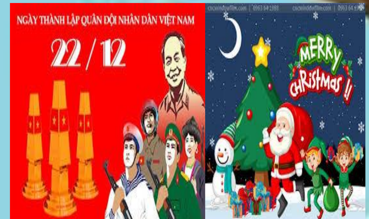
Nhánh 3: Ngày 22/12- Lễ hội Noel (2T- Từ 16/12 đến 27/12/2024)