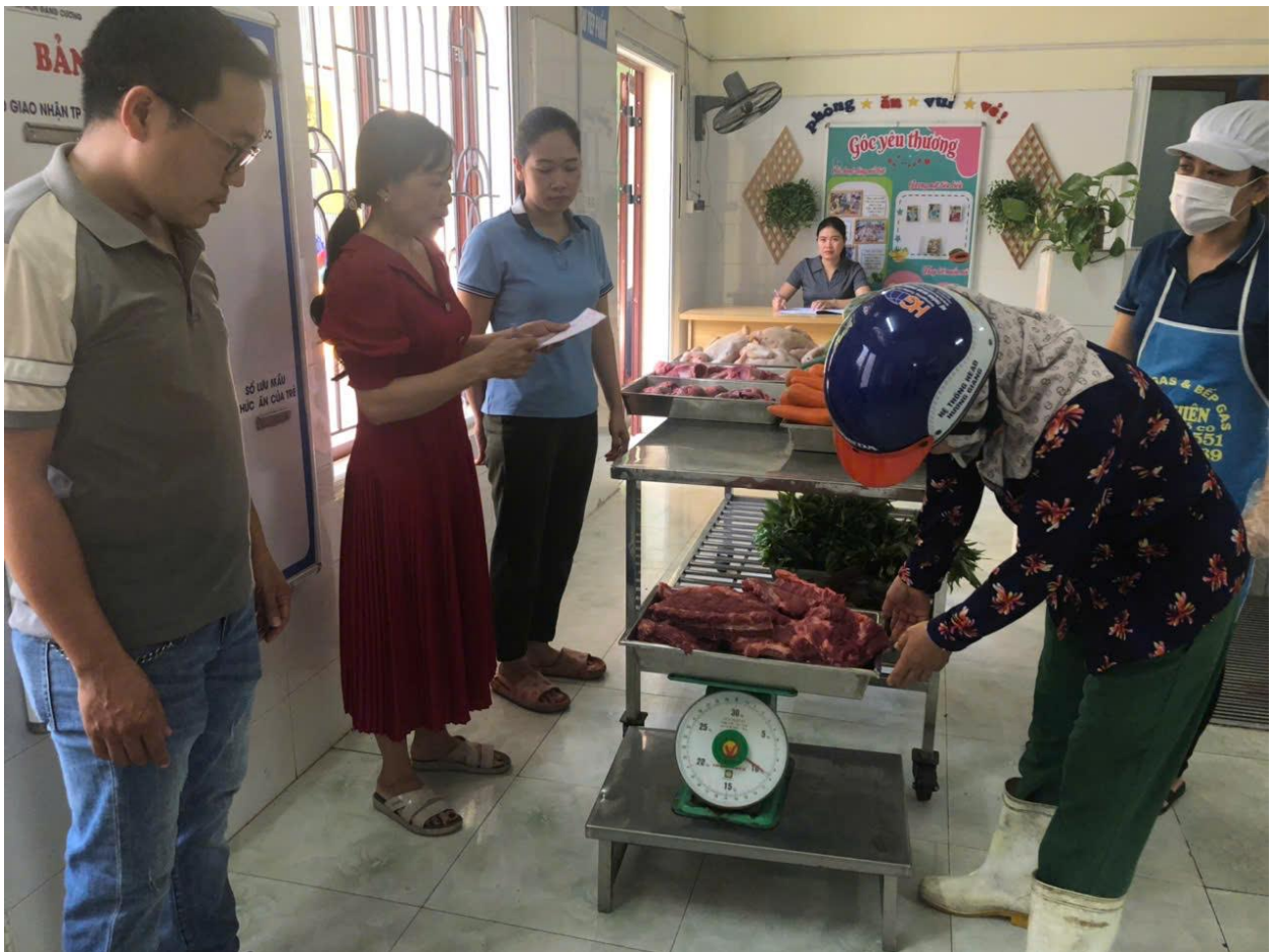
Các thực phẩm cung cấp cho bếp ăn tươi, ngon, an toàn cho bữa ăn của trẻ.