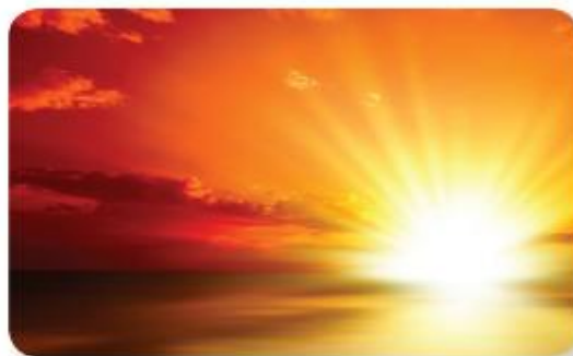
nhật từ ánh nắng mặt trời