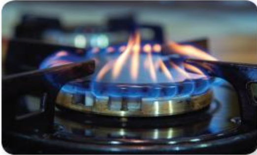
lửa từ bếp gas