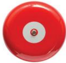
chuông báo cháy