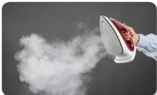
nhật từ bàn là nóng