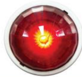
đèn báo cháy