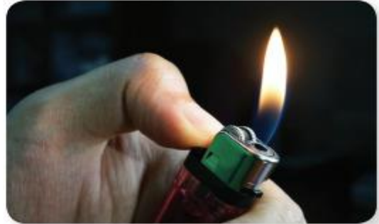
lửa từ bật lửa gas