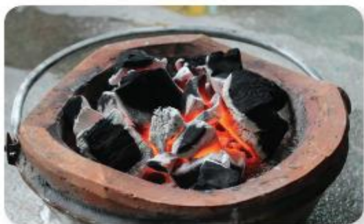
nhật từ bếp than đang cháy