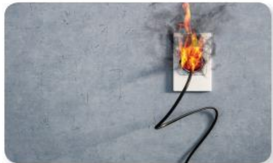
lửa do chập điện