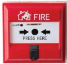
nút ấn báo cháy