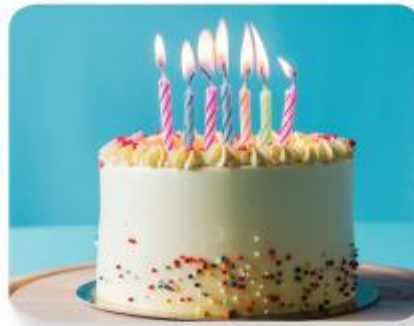
ngọn nến sinh nhật

Cháy có ích là quá trình cháy nhỏ, có thể kiểm soát được và có ích.