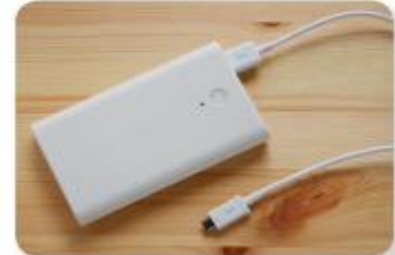
pin sạc dự phòng

Các đồ vật có sử dụng điện / pin sạc dự phòng / gas / xăng / dầu / than / sáp,... có thể sẽ gây cháy, nổ.