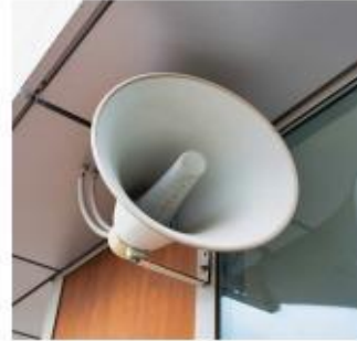
loa báo cháy