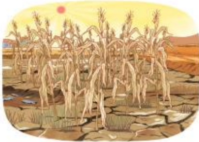
nắng nóng kéo dài