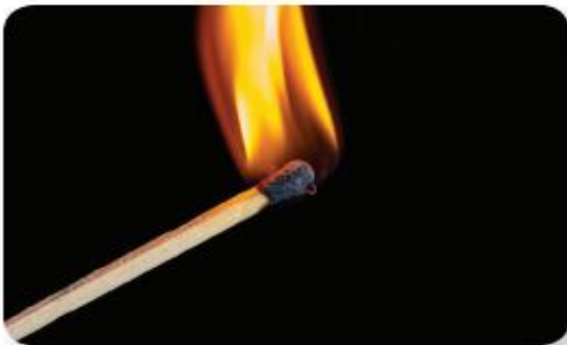
lửa từ que diêm