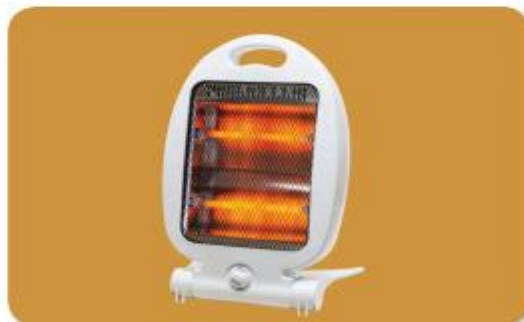
nhật từ máy sưởi đang hoạt động