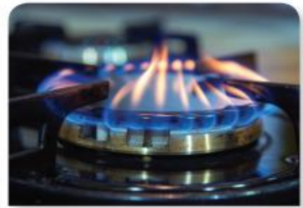
ngọn lửa bếp gas