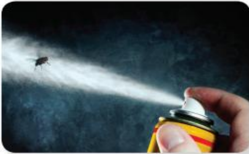
thuốc diệt côn trùng