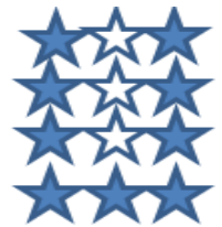
D. Hình D