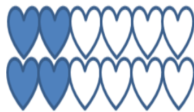
B. Hình B