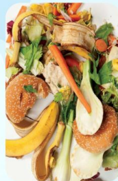
Thức ăn thừa