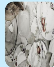
Sành, sứ, thủy tinh vỡ