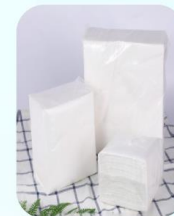
Giấy vệ sinh