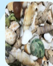
Vỏ sò, ốc