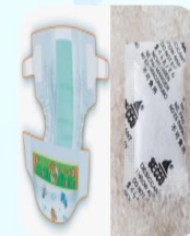
Bim, hạt hút ẩm