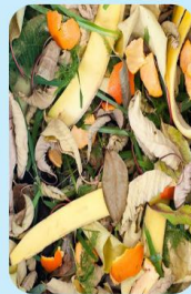
Lá cây, vỏ hoa quả