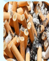
Đầu lọc thuốc lá