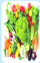
Rau, củ, quả hỏng