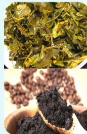
Bã trà, bã cà phê