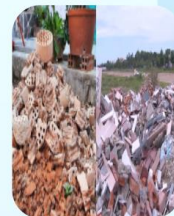
Ki thiêu, chất thải xây dựng