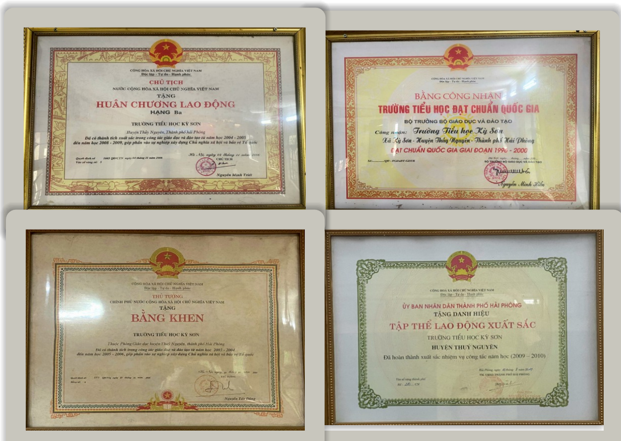
Một số thành tích nhà trường đã đạt được

Với sự nỗ lực và tâm huyết của các thế hệ thầy và trò, đến nay trường có bề dày truyền thống dạy và học đáng tự hào: Năm 2004, trường đón nhận bằng Trường chuẩn quốc gia mức độ I. Trường đạt tiêu chuẩn Trường đẹp giai đoạn III (2005-2010), Trường đẹp giai đoạn II (2011-2015). Nhiều năm liền trường đạt Tập thể lao động Xuất sắc, tập thể lao động Tiên tiến ( Năm học 2024 - 2025 đạt tập thể lao động Xuất sắc ). Năm 2006, được chủ tịch nước trao tặng Huân chương lao động hạng Ba - đạt thành tích xuất sắc trong công tác giáo dục và đào tạo từ năm học 2004-2005 đến năm học 2008-2009, góp phần vào sự nghiệp xây dựng Chủ nghĩa xã hội và bảo vệ Tổ quốc. Nhiều năm, trường đạt danh hiệu tổ chức Đảng trong sạch, vững mạnh tiêu biểu; được trao tặng bằng khen tổ chức Công đoàn vững mạnh Xuất sắc. Trường có nhiều giáo viên đạt giáo viên giỏi cấp thành phố và giáo viên giỏi cấp huyện, chiến sĩ thi đua các cấp. Nhiều học sinh đạt các giải quốc gia, cấp thành phố trong các cuộc thi Tiếng Anh, vẽ tranh,... Những thành tích trên là động lực để Hội đồng sư phạm nhà trường luôn đoàn kết, sáng tạo, tiếp tục phát huy để xây dựng nhà trường luôn vững mạnh toàn diện, là địa chỉ tin cậy của các bậc phụ huynh gửi gắm con em mình.