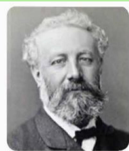
Giuyn Véc-nơ (1828 – 1905)