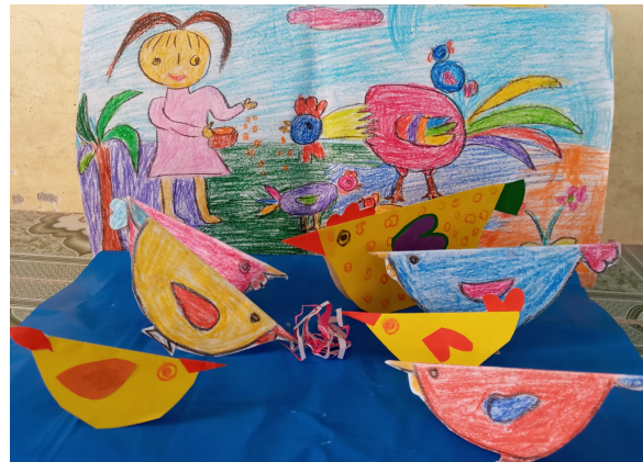
Bước 3: Sắp xếp thành tranh nhóm.