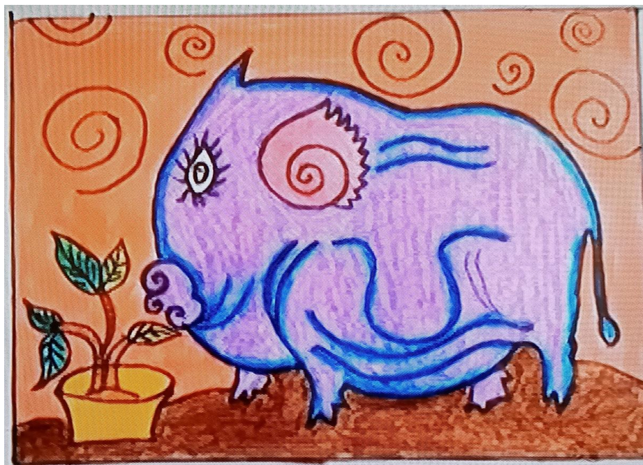
Bước 2: Vẽ Màu