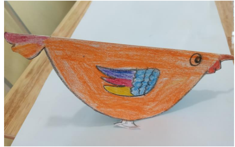
Bước 2: Cắt rời