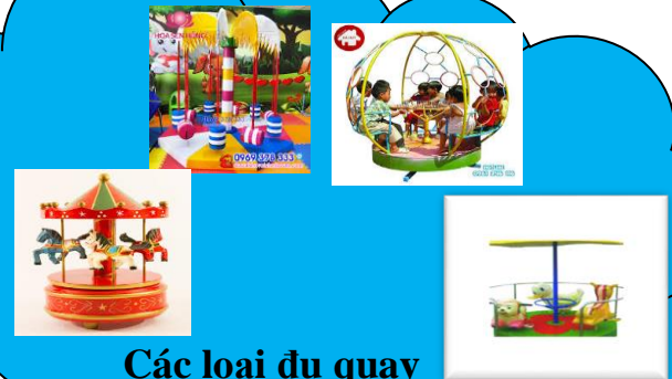
Các loại đu quay