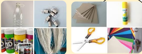
Các NVL làm đu quay