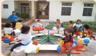
Tác dụng của đu quay