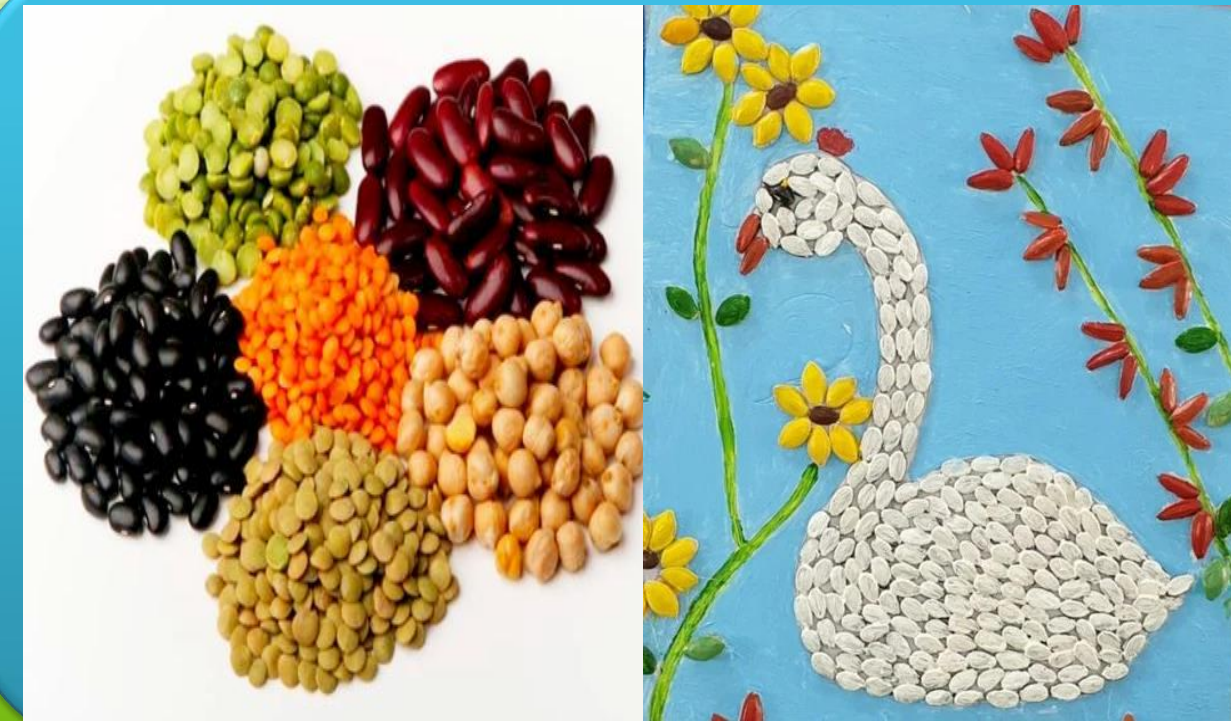
Nhánh 4: Dự án steam "Hạt bé thích"