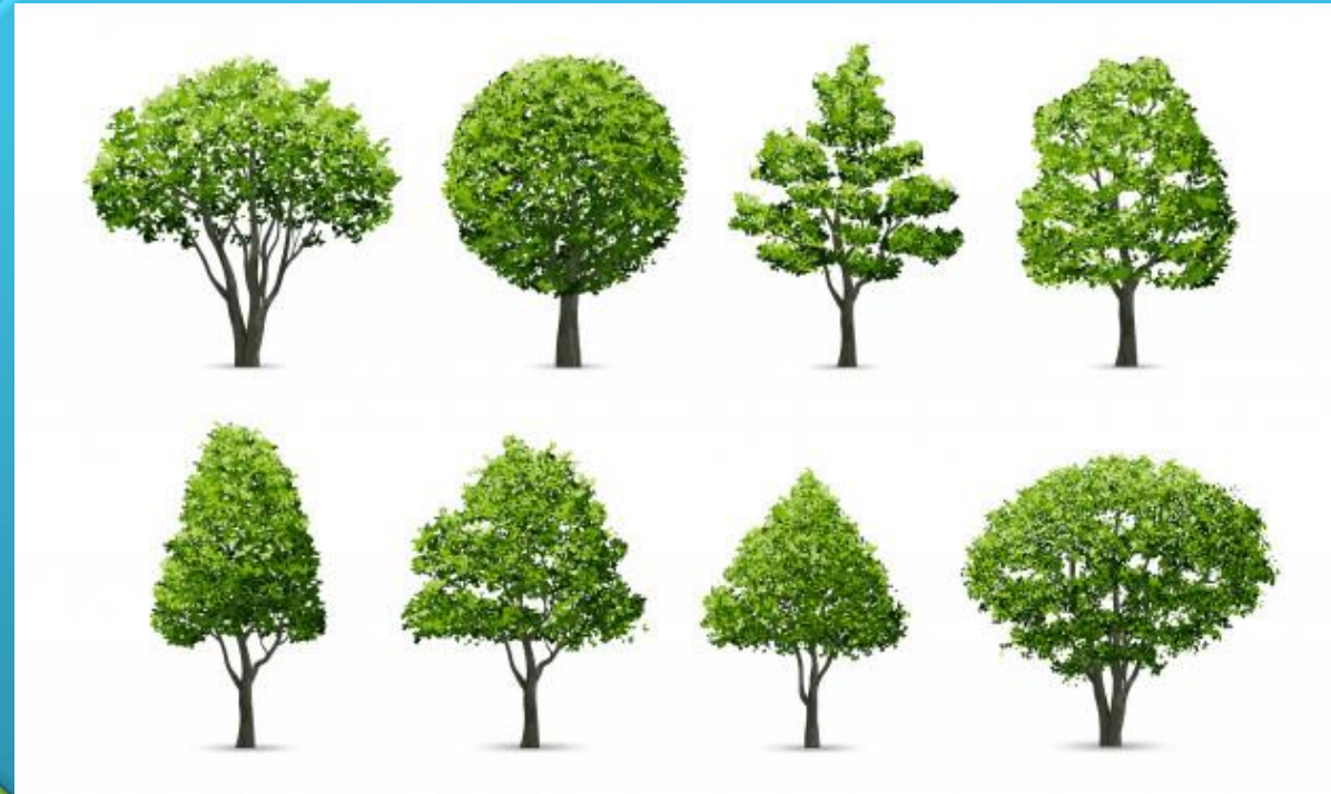
Nhánh 1: cây xanh

Thời gian thực hiện: 6 tuần Từ 13/01/2025 đến 28/02/2025