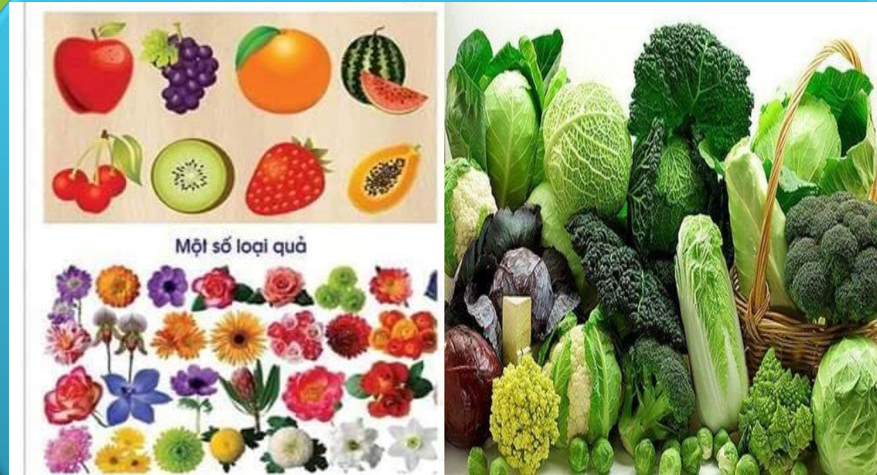
Một số loại quả