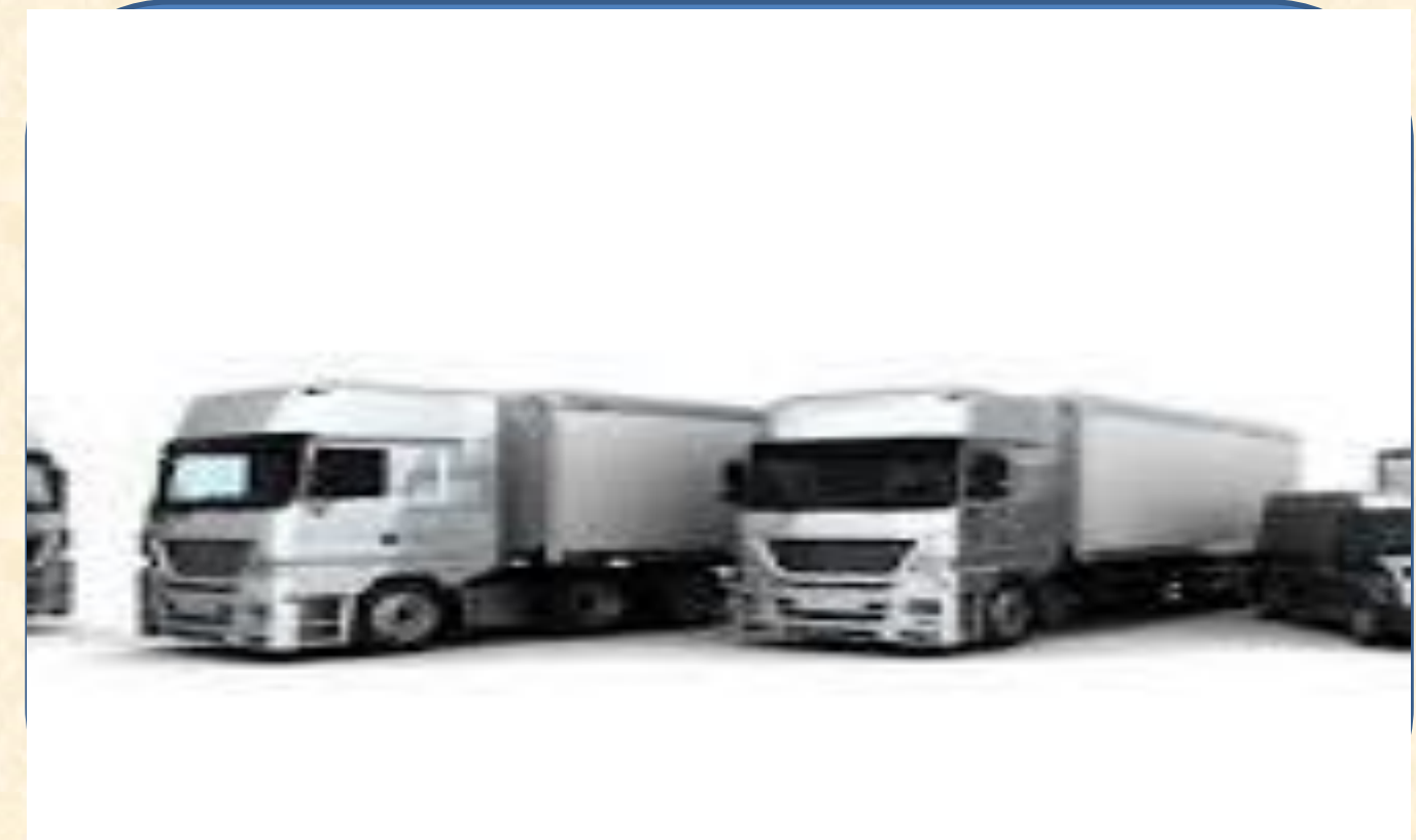
Nhánh 4: Dự án ô tô tải