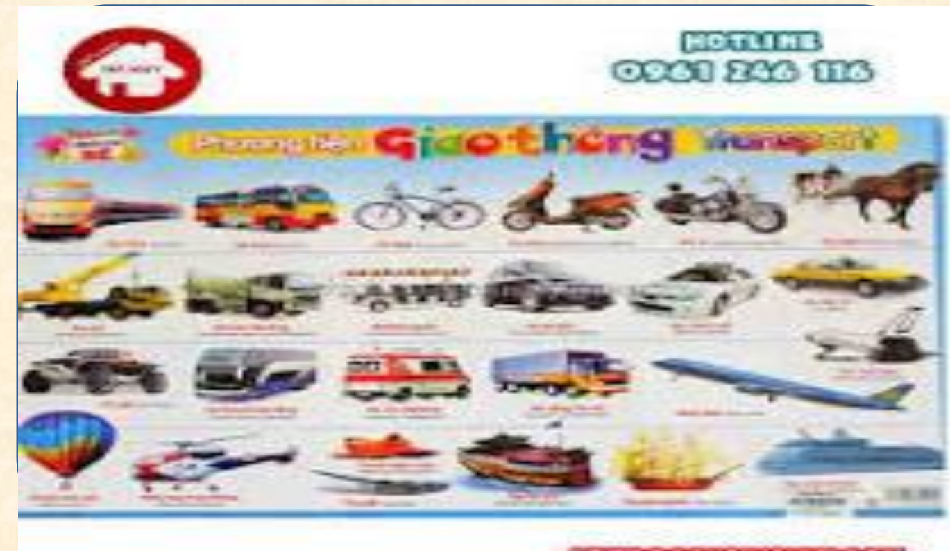
Nhánh 2: Bé đi du lịch bằng PTGT