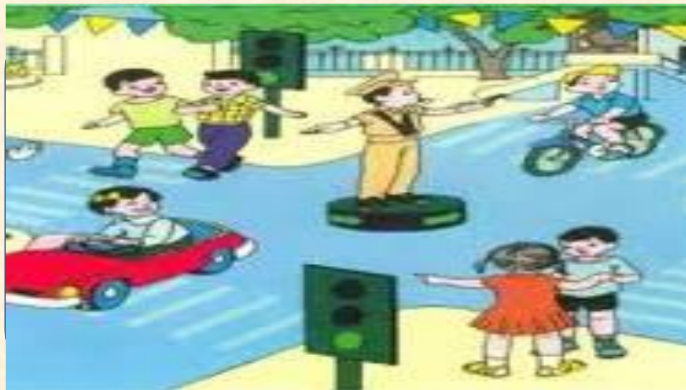
Nhánh 3: Bé tham gia GT an toàn