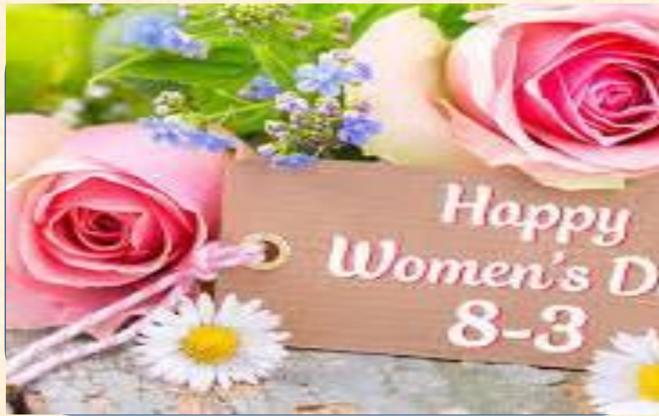
Nhánh 1: Ngày hội 8/3

Thời gian thực hiện: 4 tuần từ 03/3- 28/3/2025