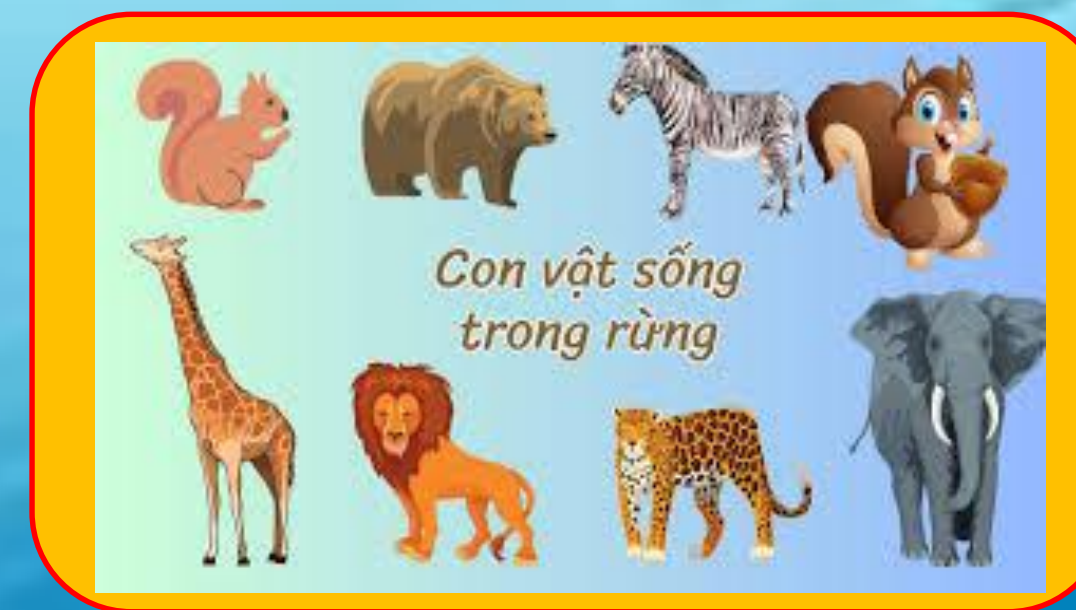
Nhánh 3: Những người bạn rừng xanh