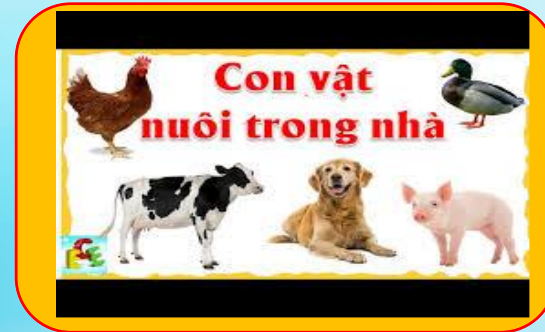
Nhánh 2: Động vật sống trong gia đình