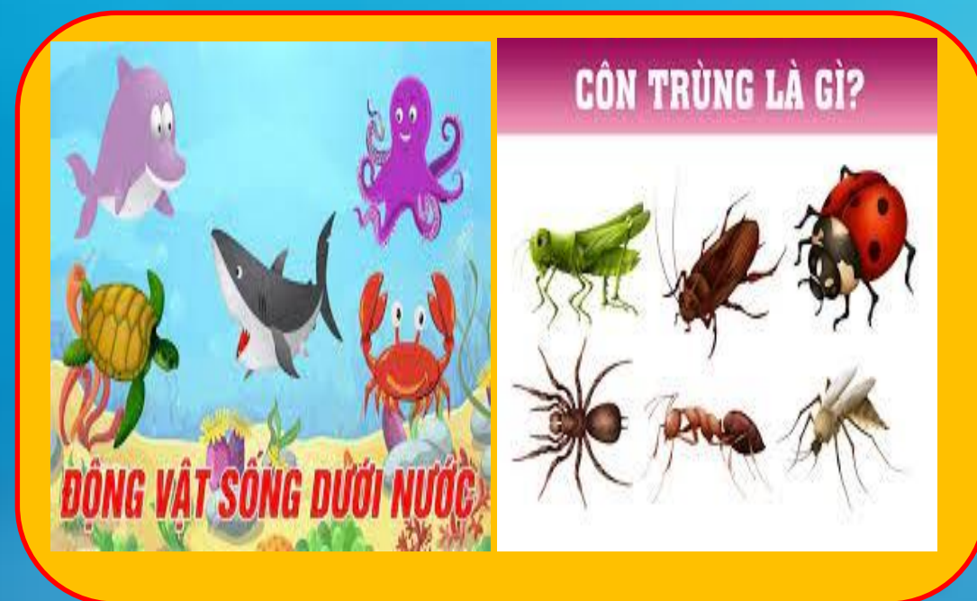
Nhánh 3: Động vật sống dưới nước và côn trùng