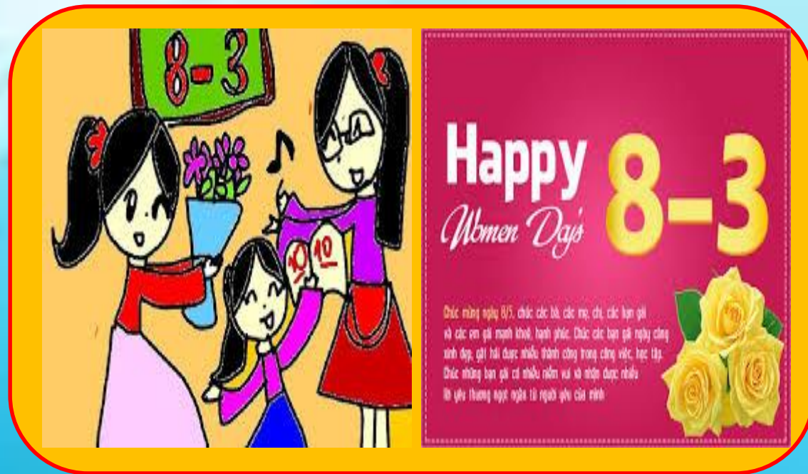
Nhánh 1: Ngày vui 8/3