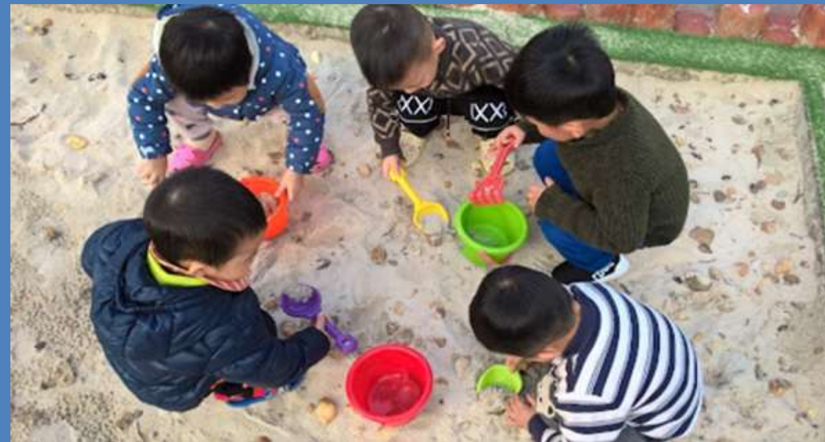
Nhánh 3: Cát, đá, sỏi