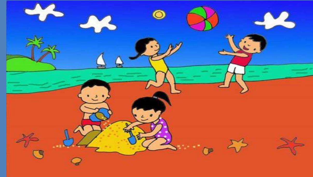
Nhánh 2: Mùa hè vui khỏe