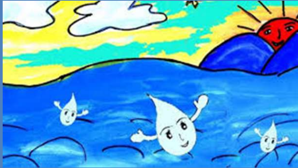
Nhánh 1: Dự án Steam: Sự kỳ diệu của nước

Thời gian thực hiện: 3 tuần từ 31/03- 18/04/25