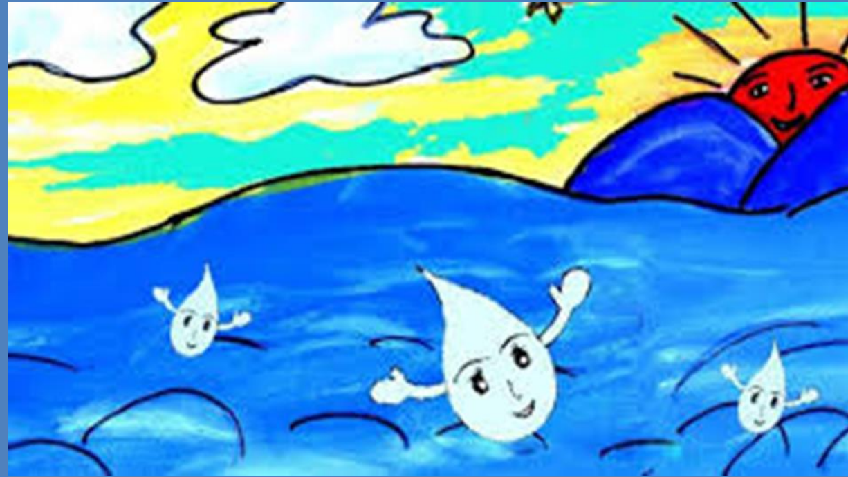
Nhánh 1: Dự án Steam: Sự kỳ diệu của nước

Thời gian thực hiện: 3 tuần từ 31/03- 18/04/25