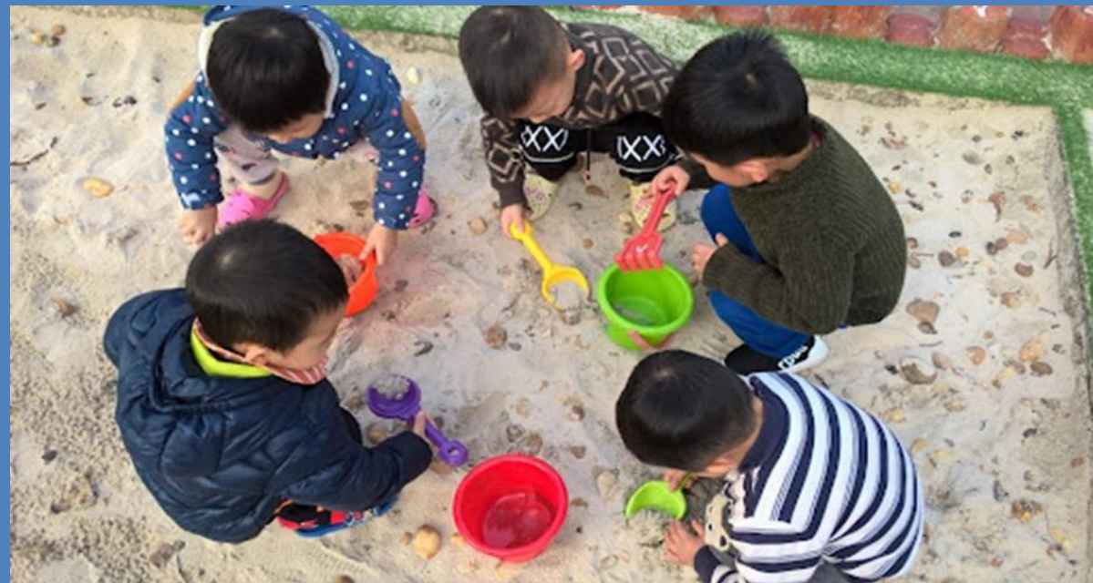
Nhánh 3: Cát, đá, sỏi