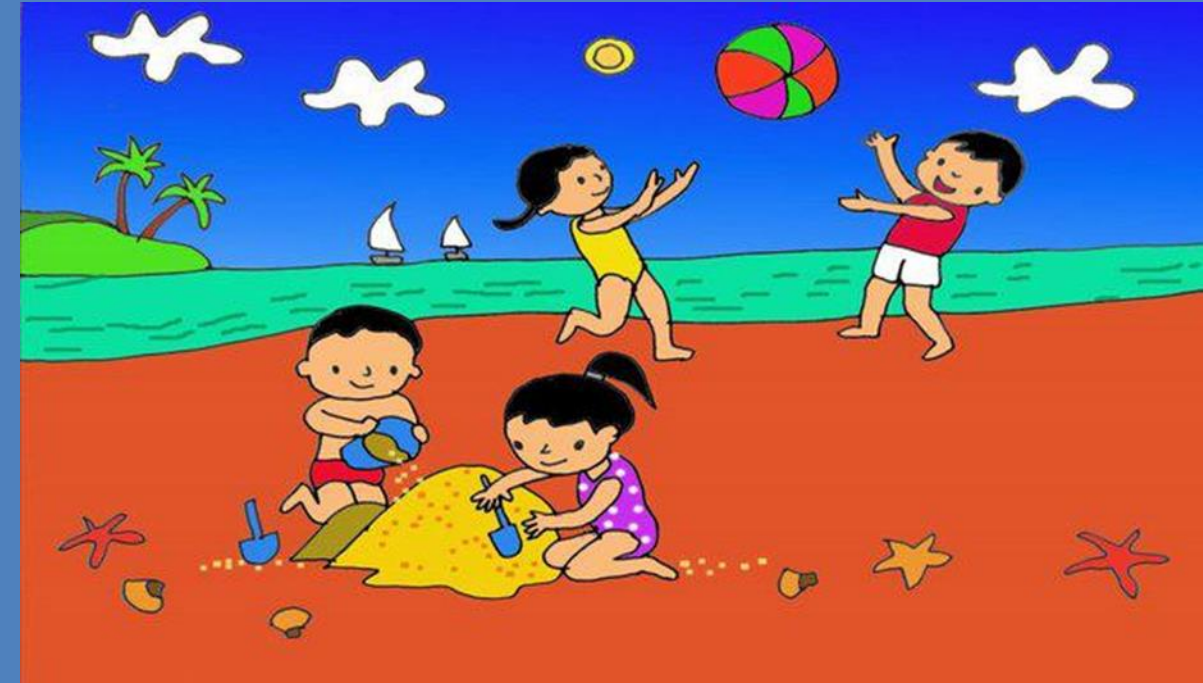
Nhánh 2: Mùa hè vui khỏe