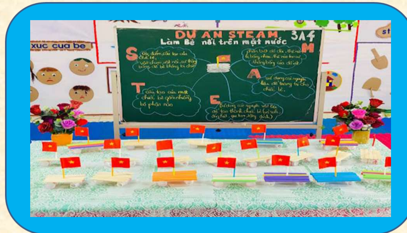
Nhánh 3: Dự kiến Steam: Bè nổi