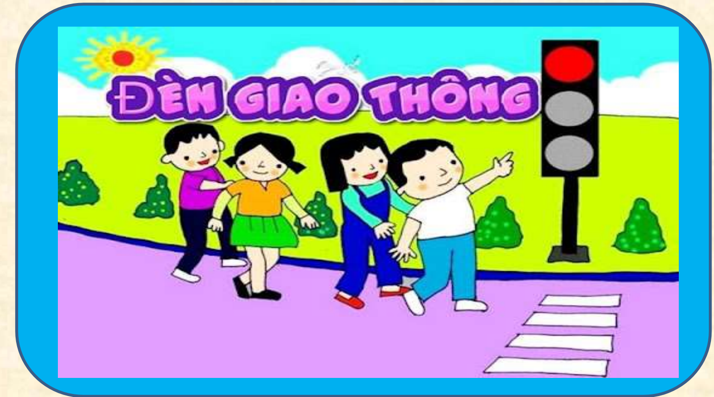
Nhánh 2: Bé tham gia GT an toàn