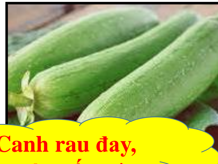
Canh rau đay, mướp nấu cáy