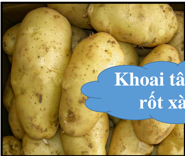
Khoai tây, cà rốt xào