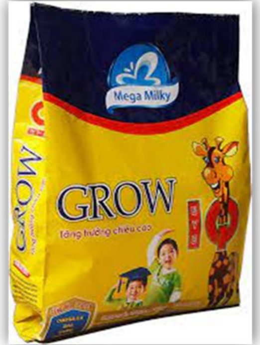
Uống sữa Grow