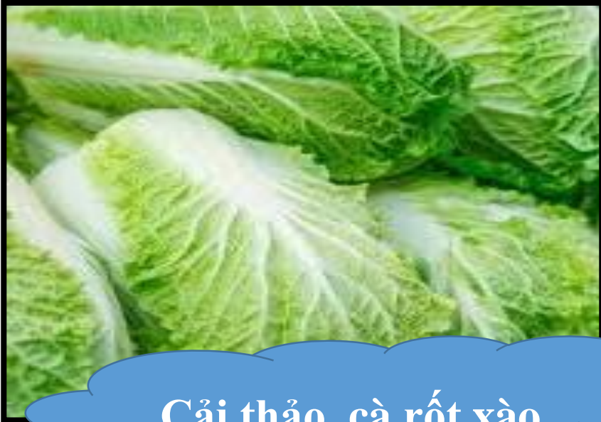
Cải thảo, cà rốt xào