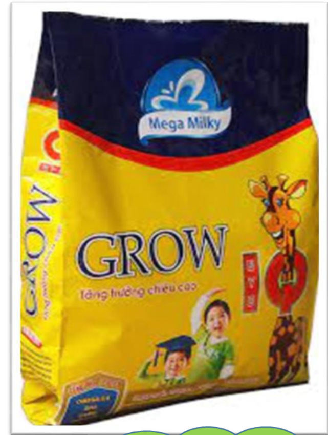
Uống sữa Grow