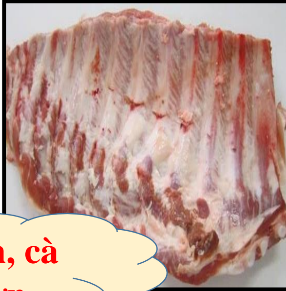
Canh bí xanh, cà rốt nấu sườn