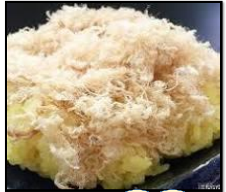
Mẫu giáo: Xôi ruốc