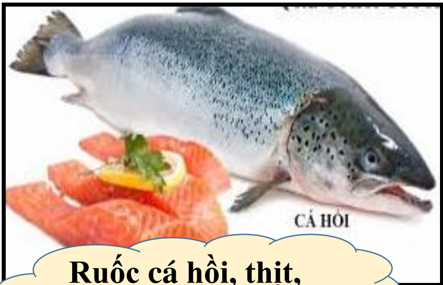
Ruốc cá hồi, thịt, trứng trộn