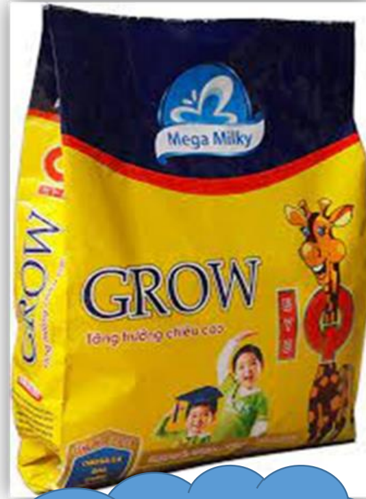
Uống sữa Grow