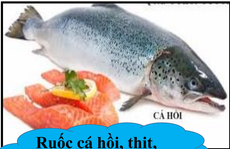
Ruốc cá hồi, thịt, trứng trộn