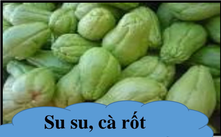
Su su, cà rốt luộc