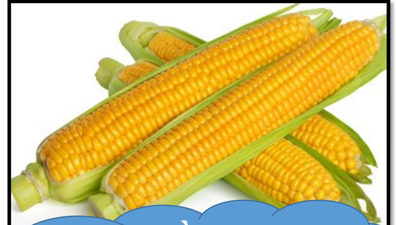
Bữa chiều MG: - Bánh bông lan, - Sữa ngô