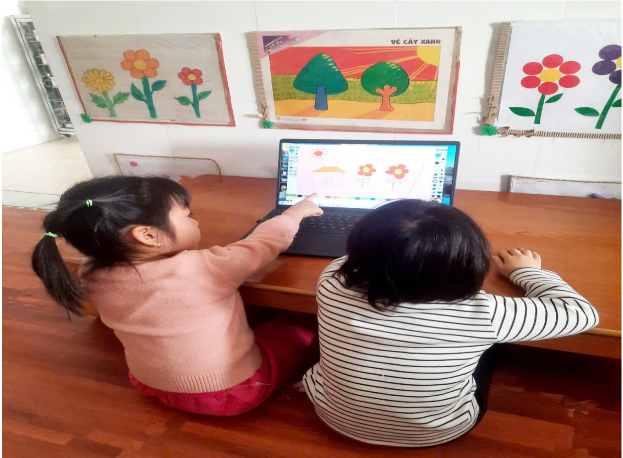
Phụ lục 2: Hình ảnh trẻ hứng thú vẽ trên máy tính