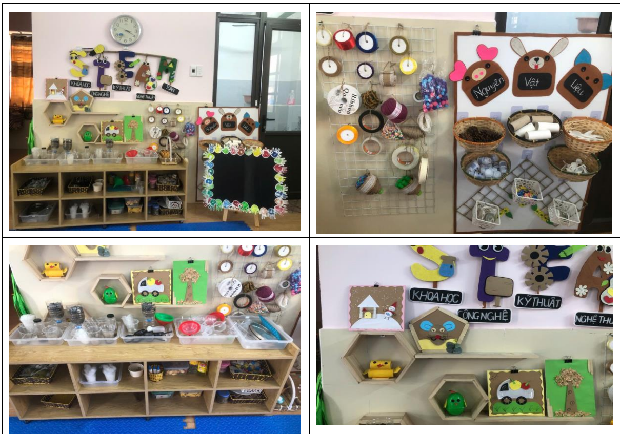
Hình ảnh: Tạo môi trường góc Steam với tên góc, cách bố trí và các vật dụng, nguyên liệu.

Trước tiên, việc tổ chức không gian lớp học cần được thiết kế một cách linh hoạt, có thể dễ dàng thay đổi để phù hợp với từng hoạt động. Không gian này cần đảm bảo đủ rộng để trẻ có thể di chuyển tự do, tương tác với nhau và với các đồ vật xung quanh. Bàn ghế có thể được sắp xếp theo nhiều hình thức khác nhau như vòng tròn, nhóm nhỏ hay hình chữ U để tạo điều kiện thuận lợi cho việc giao tiếp và thảo luận.