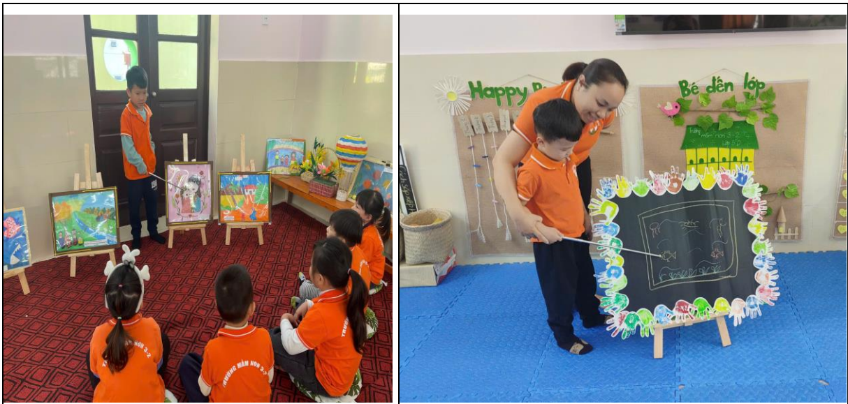
Hình ảnh: Cô giáo gợi ý, hướng dẫn trẻ trình bày ý tưởng

Hướng dẫn kỹ năng trình bày là một phần không thể thiếu trong quá trình phát triển kỹ năng thuyết trình cho trẻ. Giáo viên cần chú ý hướng dẫn trẻ cách sử dụng giọng nói, ngôn ngữ cơ thể, cách trình bày ý tưởng một cách logic và rõ ràng. Việc hướng dẫn cần được thực hiện một cách nhẹ nhàng, tự nhiên thông qua các tình huống cụ thể.