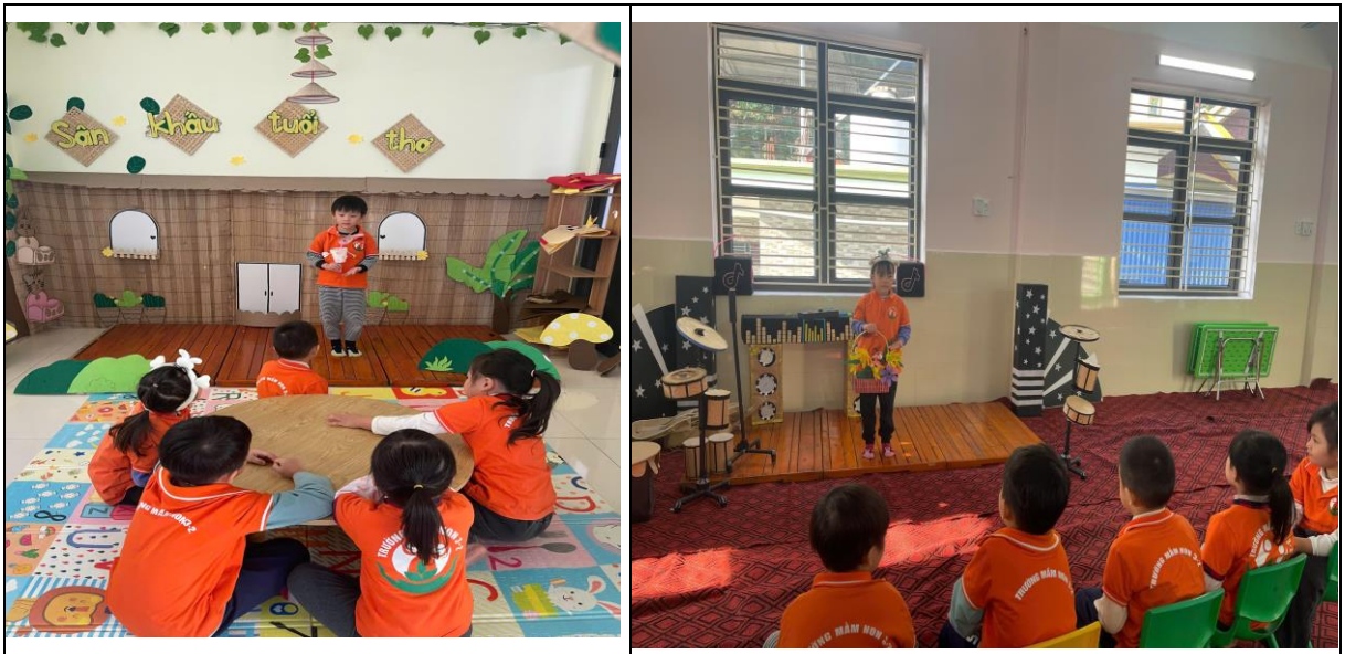
Hình ảnh: Hình ảnh sân khấu trẻ thuyết trình.

Sân khấu mini được thiết kế như một không gian đặc biệt, nơi trẻ có thể tự tin chia sẻ những phát hiện của mình. Bảng trưng bày sản phẩm được bố trí để trẻ có thể giới thiệu các tác phẩm nghệ thuật, mô hình mà mình đã tạo ra.