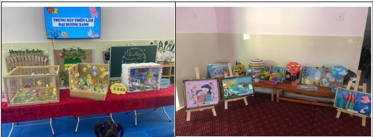
Hình ảnh: Trưng bày các sản phẩm steam mà trẻ đã thực hiện

Trong "Ngày hội bé khéo tay", không gian trưng bày cần được bố trí sinh động, hấp dẫn với các góc trưng bày được trang trí bắt mắt. Mỗi sản phẩm STEAM của trẻ cần được đặt ở vị trí dễ nhìn, dễ tiếp cận. Giáo viên có thể hỗ trợ bằng cách dán nhãn, ghi chú ngắn gọn về quá trình thực hiện của trẻ.