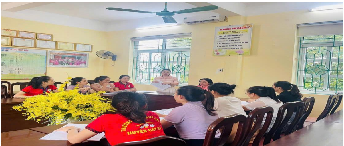
Hình ảnh: Sinh hoạt chuyên môn trường

Là một giáo viên trẻ tôi luôn xác định và thực hiện tốt việc học tập, bồi dưỡng chuyên môn cho bản thân. Đó chính là kim chỉ nam để giáo viên nắm bắt kiến thức kịp thời áp dụng vào thực tiễn công tác chăm sóc giáo dục trẻ. Ngay từ đầu năm học chuyên môn nhà trường đã theo chỉ đạo của sở giáo dục Hải Phòng khuyến khích giáo viên tích cực ứng dụng chuyển đổi số trong công tác tuyên truyền và chăm sóc trẻ. Chuyên môn nhà trường đã thường xuyên tổ chức các buổi sinh hoạt chuyên môn bồi dưỡng giáo viên về các ứng dụng công nghệ chuyển đổi số để giáo viên tích hợp vào công tác giảng dạy như: AI, google form, padlet,.. từ đó đã giúp tôi và đồng nghiệp có thêm nhiều kiến thức kỹ năng về công nghệ thông tin để ứng dụng vào công tác giảng dạy thêm sáng tạo và có hiệu quả hơn