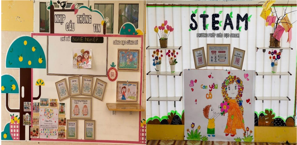
Hình ảnh: Bảng tuyên truyền tại lớp

Hơn nữa tôi sắp xếp mảng tuyên truyền một cách phù hợp: Vị trí ở ngay cửa lớp, nơi phụ huynh đưa đón con hàng ngày, tôi phân bổ nội dung rõ ràng từng mảng: Sức khỏe, học tập, sản phẩm của trẻ, phương pháp mới giáo dục STEAM riêng biệt..... Điều này giúp cho phụ huynh dễ thấy, dễ hiểu và nắm bắt được các nội dung rõ ràng, không rối mắt.