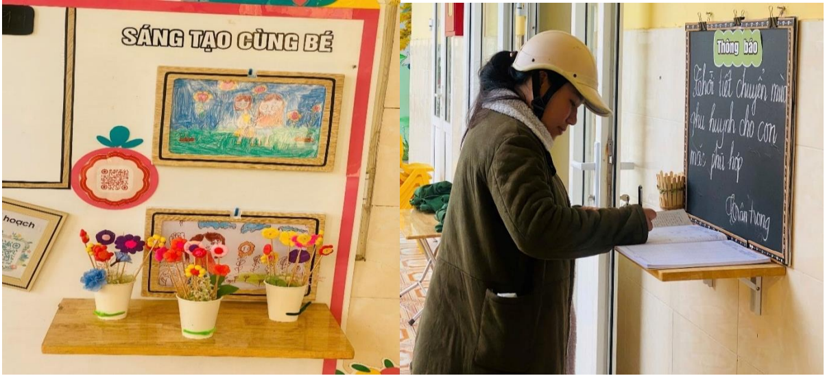
Hình ảnh: Những chiếc bàn lật được sử dụng sáng tạo, hiệu quả trong tuyên truyền

những chiếc bàn lật để sản phẩm chủ đề của trẻ hay những chiếc bàn này còn được sử dụng để phụ huynh kí sổ hàng ngày khi đưa con đến lớp. Điều đó đã giúp môi trường tuyên truyền bên ngoài của lớp tôi sáng tạo và hiện đại hơn.