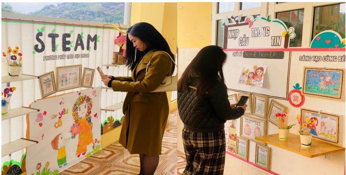
Hình ảnh: Phụ huynh cập nhật hoạt động của con qua bảng tuyên truyền

Xã hội đang ngày một phát triển, công nghệ số đang chiếm ưu thế hóa toàn cầu. Khi mà phụ huynh nào cũng đã có và sử dụng những chiếc điện thoại thông minh thì tôi đã đưa những đường link, mã QR về các bài học các nội dung tuyên truyền ra ngoài bảng tin để phụ huynh cập nhật tình hình học tập của các con bất cứ lúc nào.