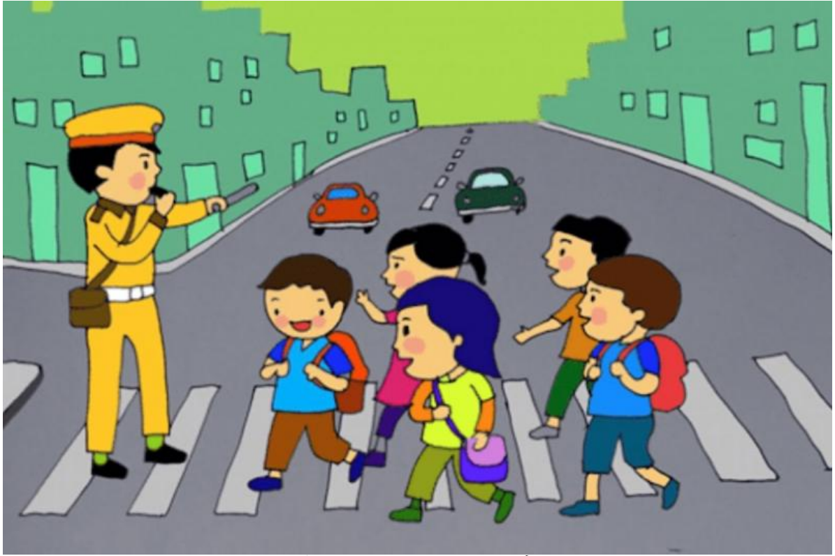
Phiêu Lưu Đường Phố