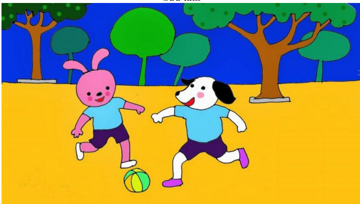
Chuyện Đi An Toàn của Thỏ Con