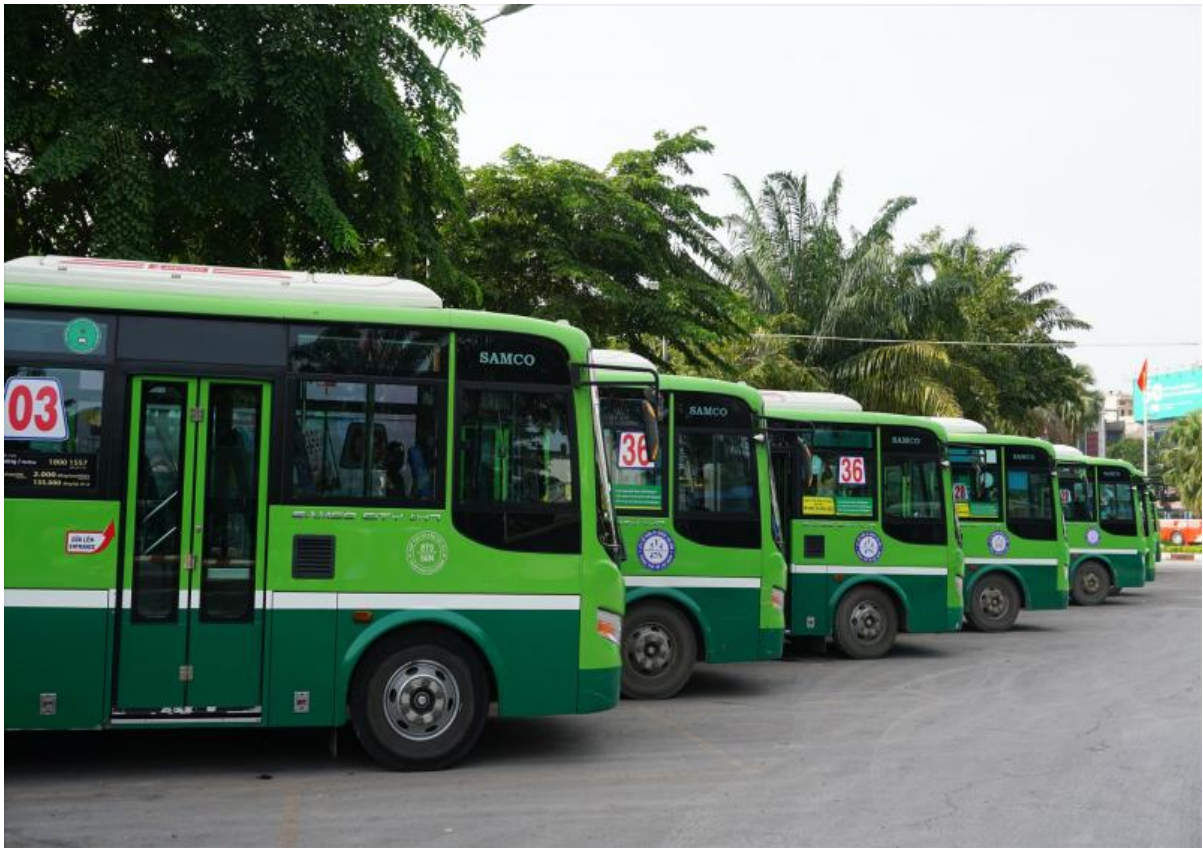
An toàn khi đi xe buýt.