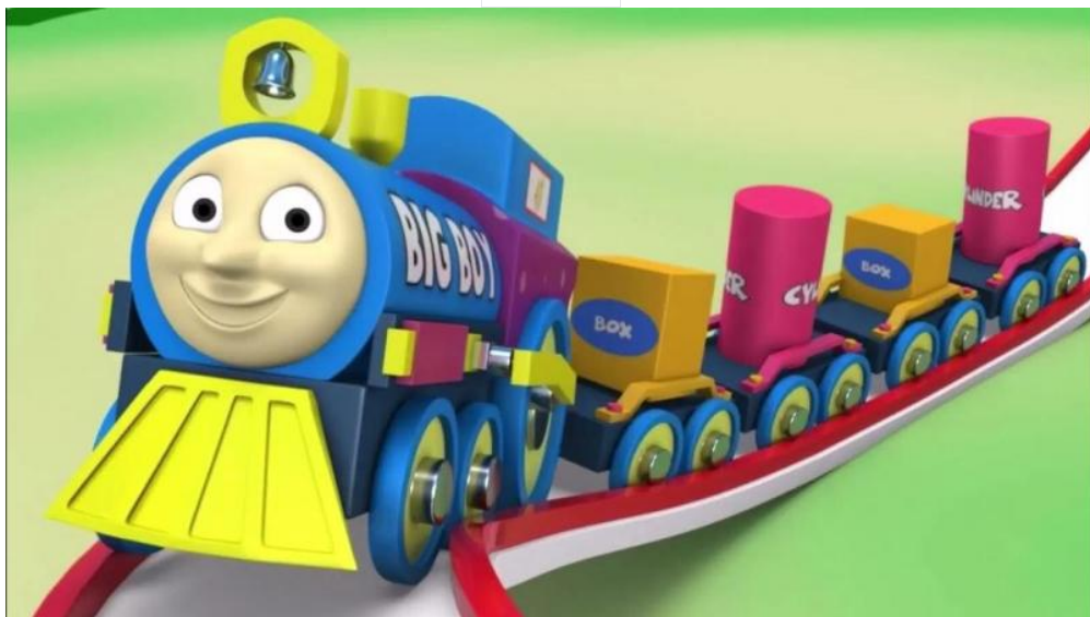
Tấm lòng nhân ái của chiếc đầu máy xe lửa