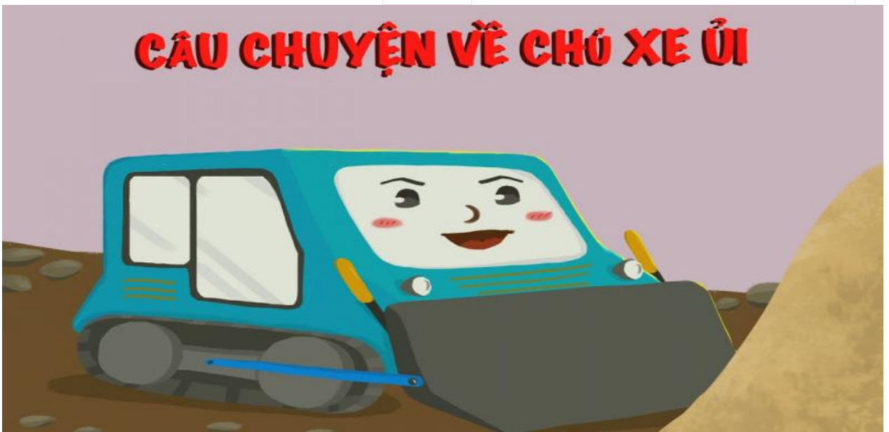
Câu chuyện về chú xe ủi