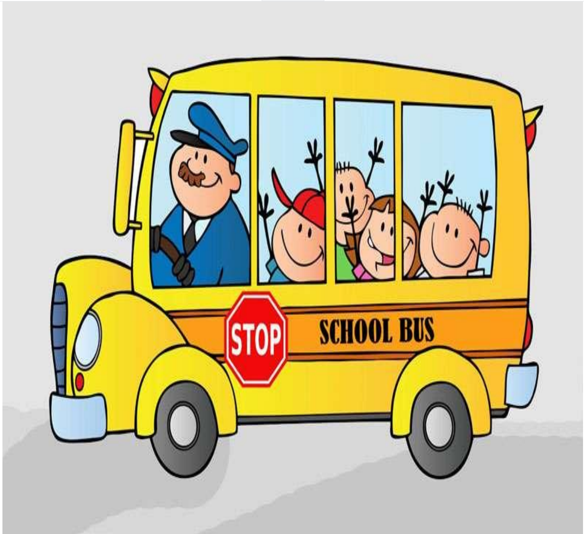
An toàn khi đi xe buýt.