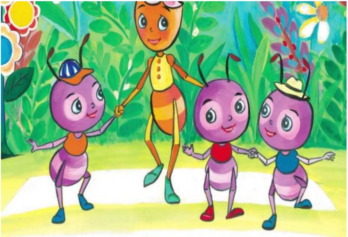
Cuộc thi an toàn giao thông