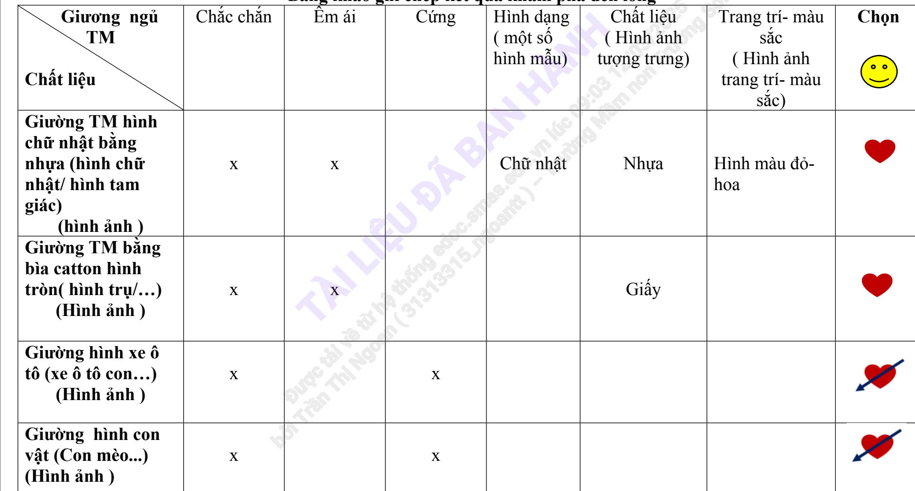
Bảng khảo ghi chép kết quả khám phá đèn lồng