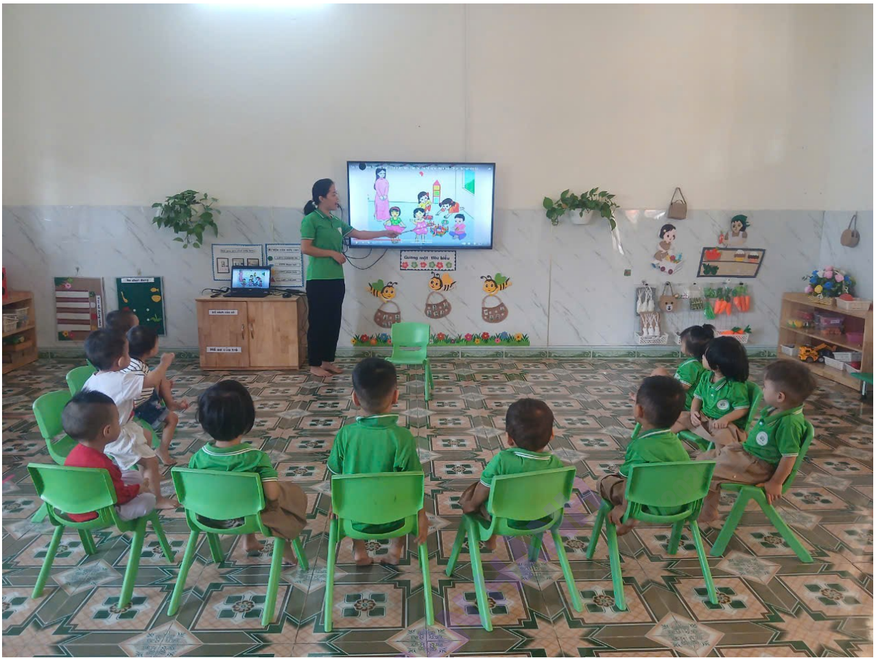
(Giờ học của trẻ)