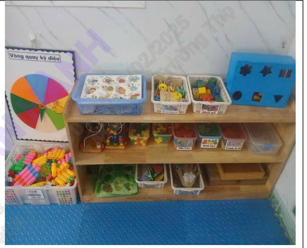
Sắp xếp góc chơi khoa học, làm đồ chơi hấp dẫn thu hút trẻ hoạt động

TÀI LIỆU Được tải về từ hệ thống bởi Trịnh Anh Tuyết (31313317)