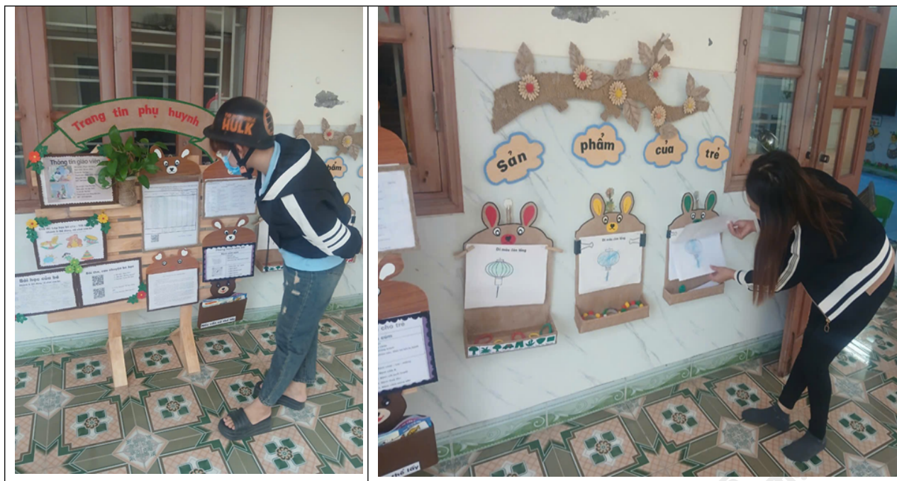
Xây dựng góc tuyên truyền tại lớp.