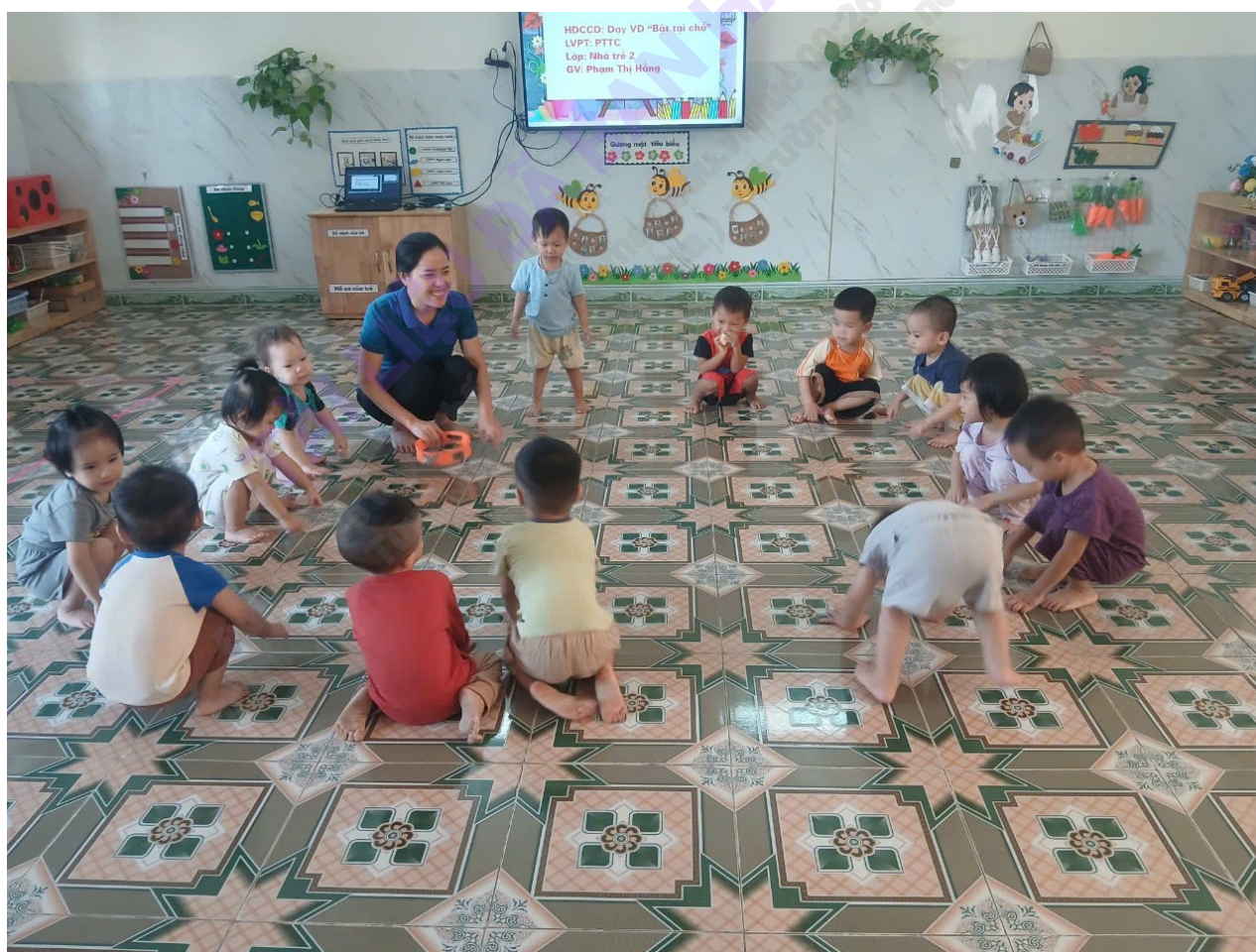
Hình ảnh trẻ vui chơi cùng cô và các bạn