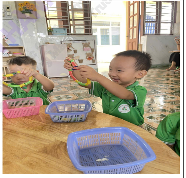
(Cô và trẻ tham gia vào các hoạt động)