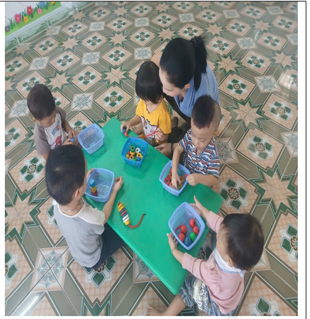
(Hướng dẫn trẻ chơi và chơi cùng trẻ)