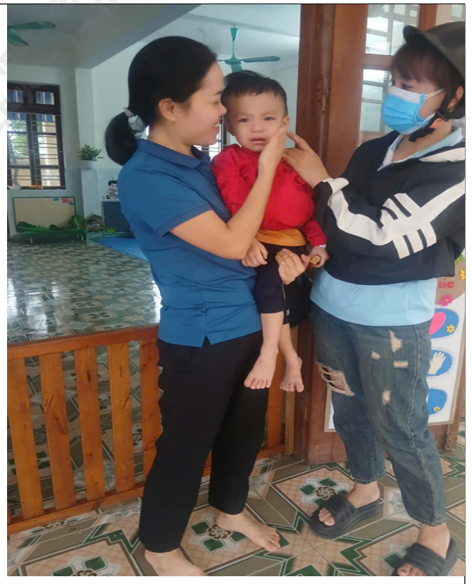
(Hình ảnh ngày đầu trẻ tới lớp)