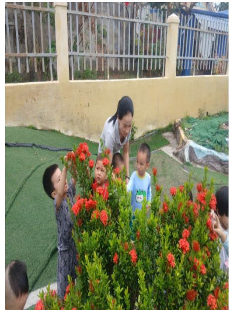
Hoạt động ngoài trời