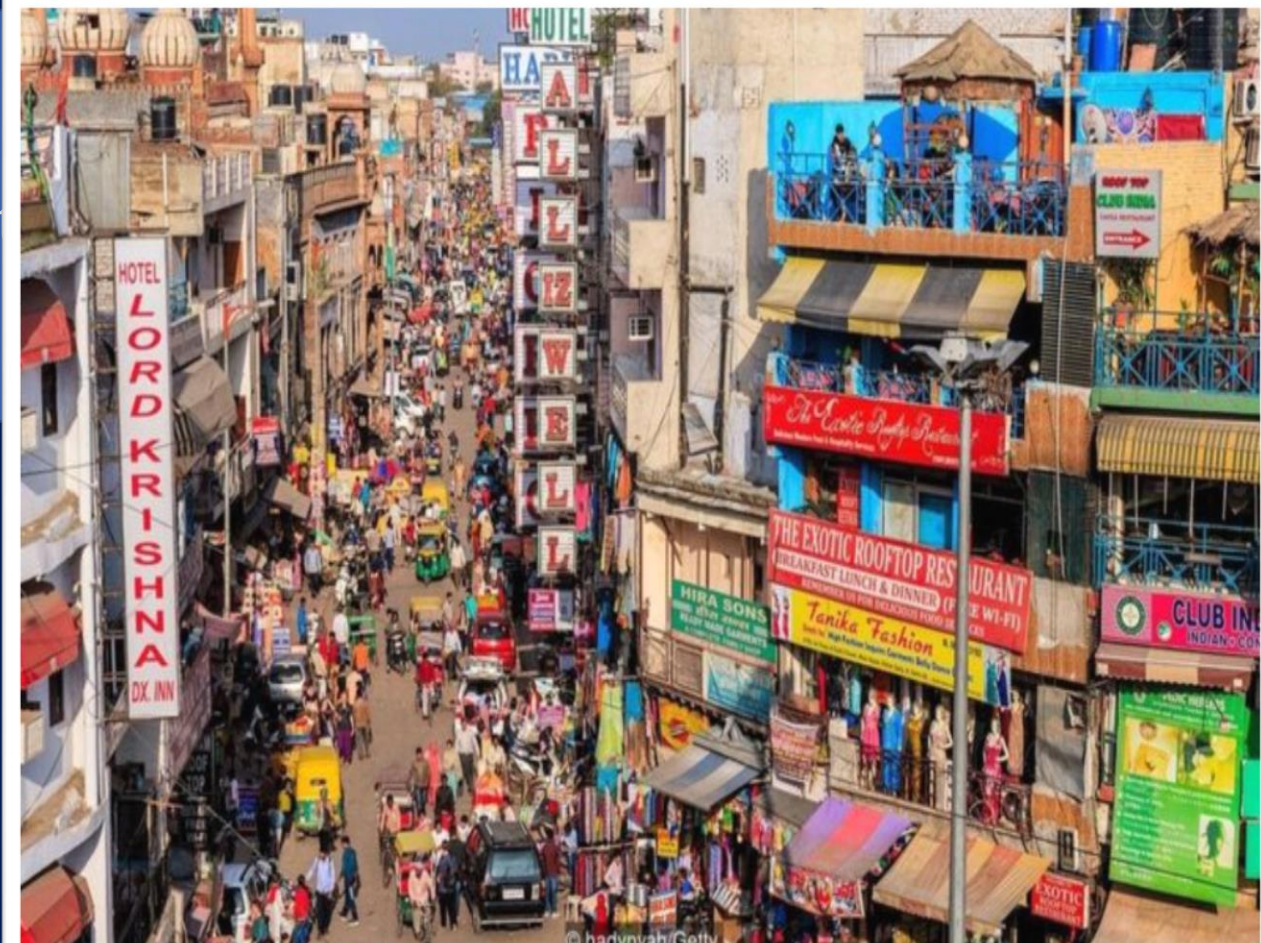
Thành phố Niu-đê-li – Ấn Độ