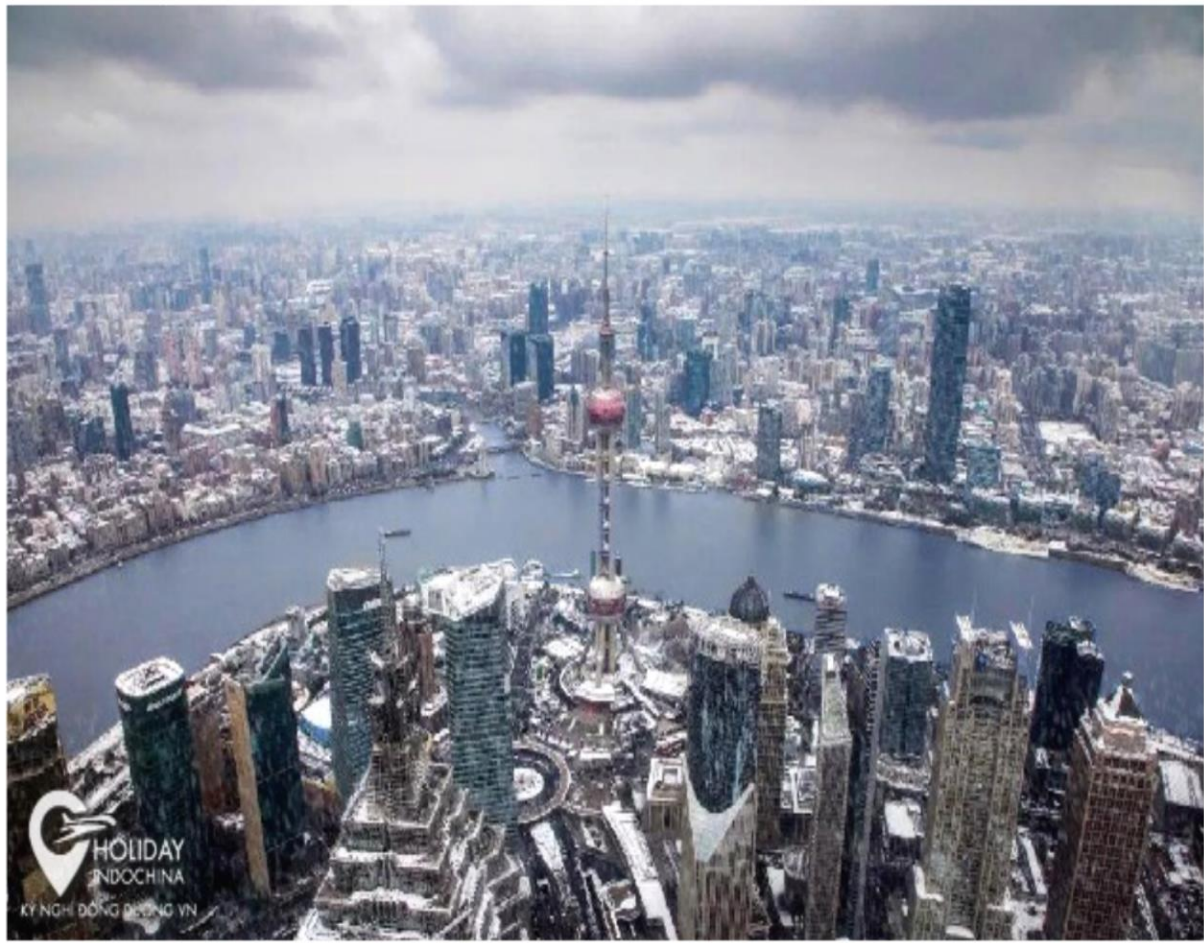
Thành phố Thượng Hải – Trung Quốc