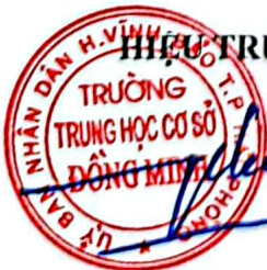
HIỆU TRƯỞNG Phạm Xuân Hưng

Biên bản được kết thúc cùng với nội dung buổi tuyên truyền vào hồi 7h45 cùng ngày./.