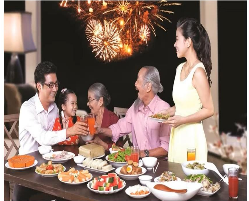
Đón giao thừa