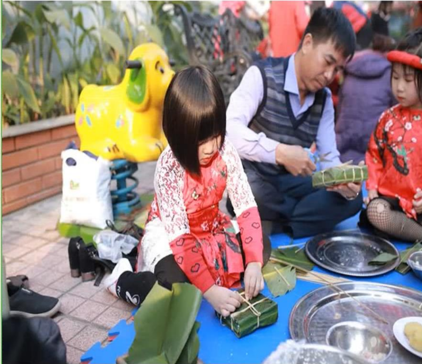
Gói bánh chưng