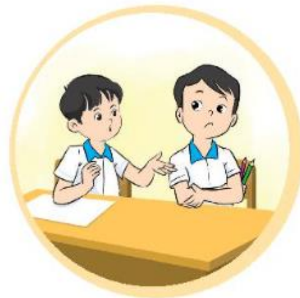
Không hợp tác