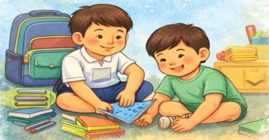
Tự chăm sóc bản thân