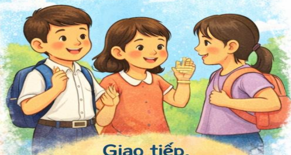
Giao tiếp, lám quên, chào hỏi