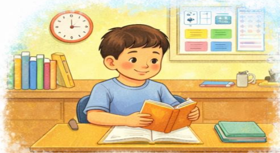
Tự học, xây dựng thói quen học tập