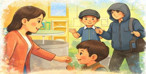
Bảo vệ bản thân, xử lý tình huống nguy hiểm