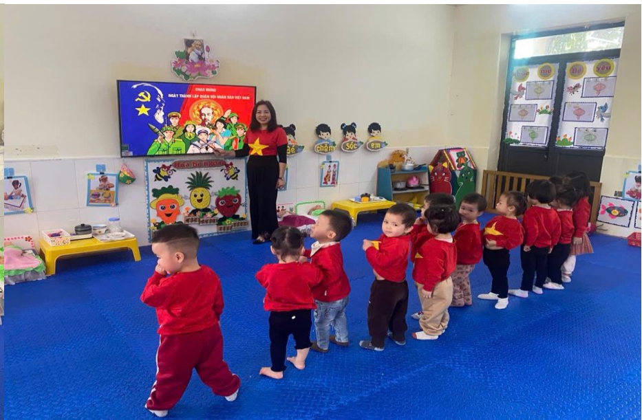
Hình ảnh bé lớp nhà trẻ thực hiện vận động: “Đi theo đường ngoằn ngoèo”