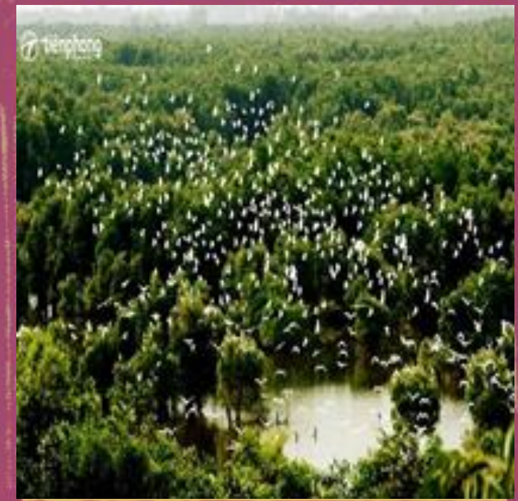
Vườn quốc gia Tràm Chim (Đồng Tháp)