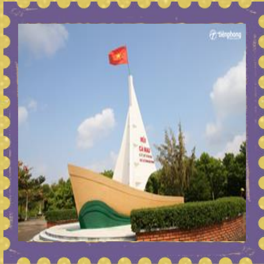
Mũi Cà Mau

Xem các hình ảnh sau, hãy kể tên một số những danh lam thắng cảnh nổi tiếng ở Nam Bộ.