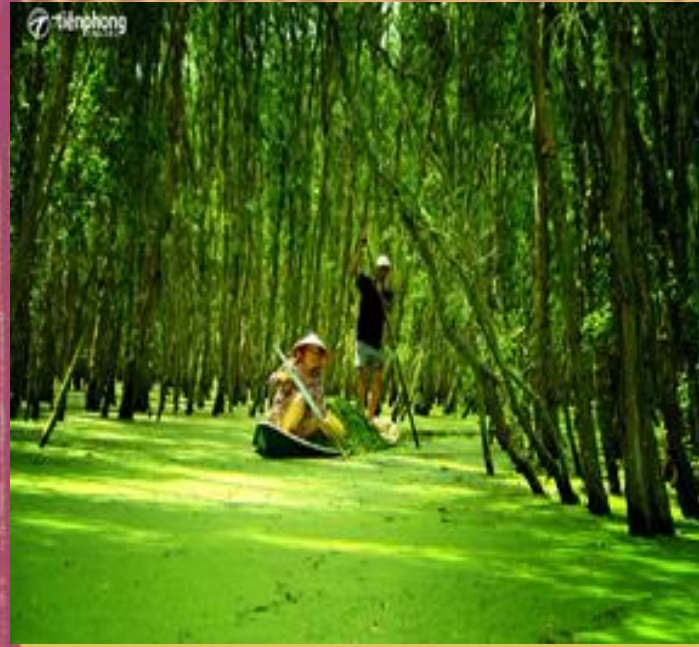
Rừng trà Trà Sư (An Giang)