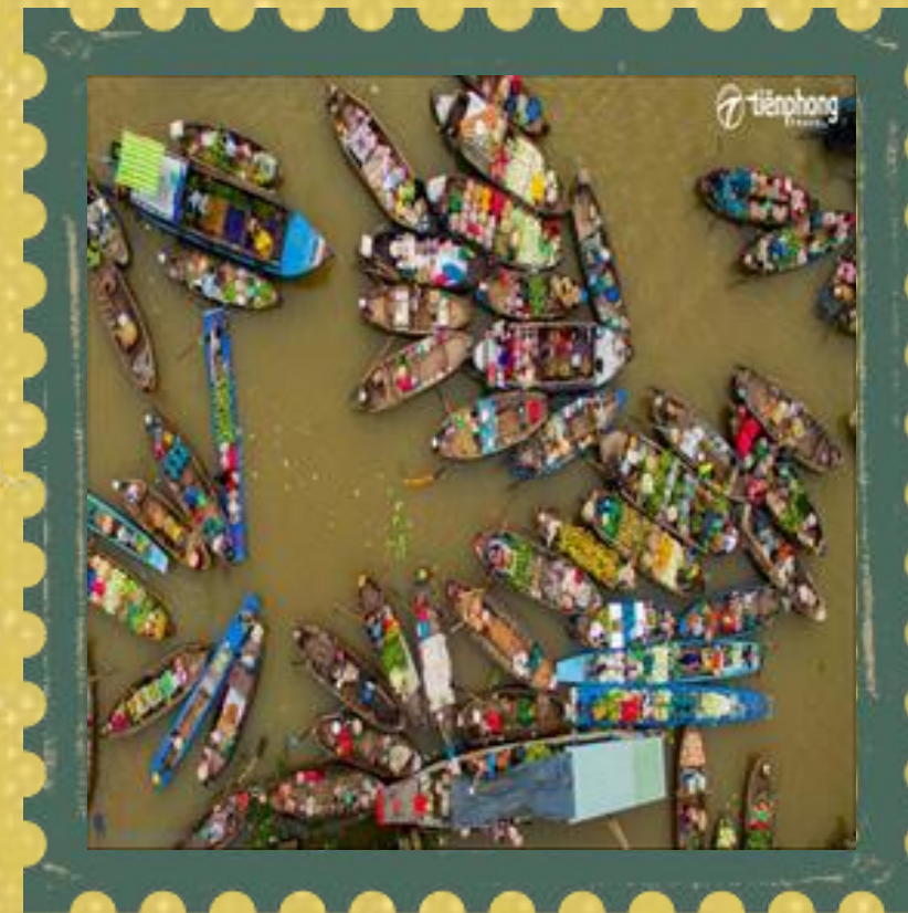
Chợ nổi Cái Răng (Cần Thơ)