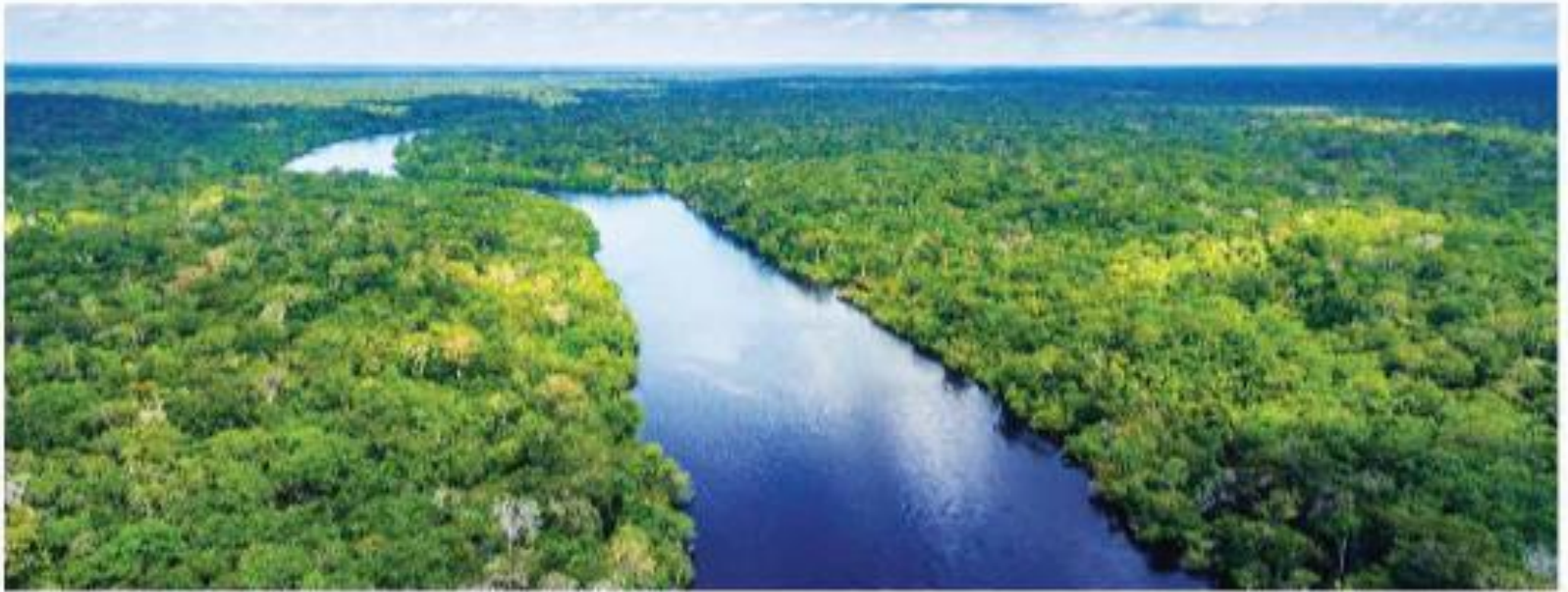
▲ Hình 7. Một phần rừng A-ma-dôn ở Bra-xin (Brazil)