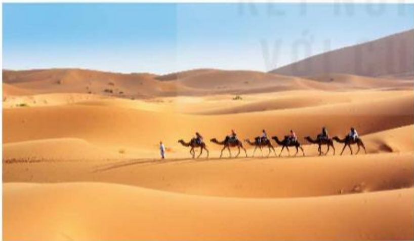
▲ Hình 5. Hoang mạc Xa-ha-ra ở Ma-rốc (Morocco)