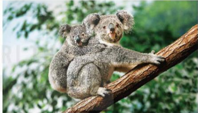
▲ Hình 9. Gấu túi