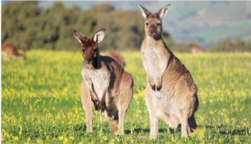
▲ Hình 8. Can-gu-ru (Kangaroo)