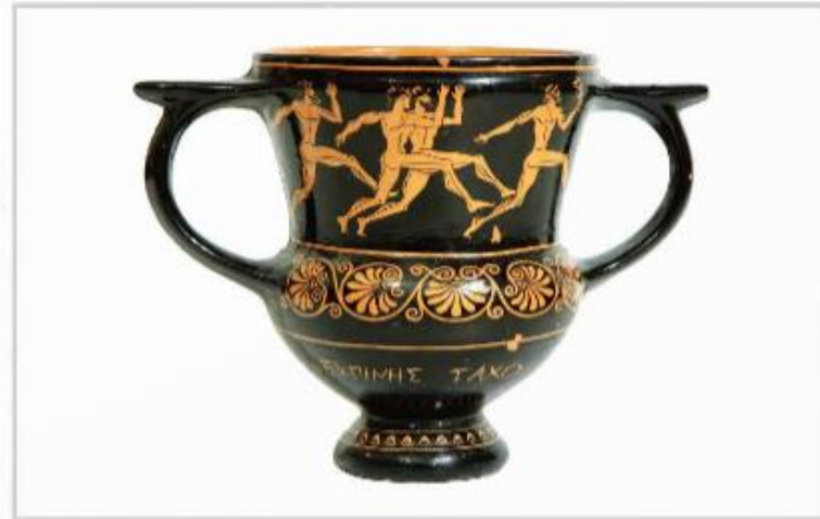
▲ Hình 6. Hình vẽ các vận động viên điền kinh trên bình gốm

(Theo Đặng Đức An (Chủ biên), Những mẫu chuyện lịch sử thế giới , Sđd)