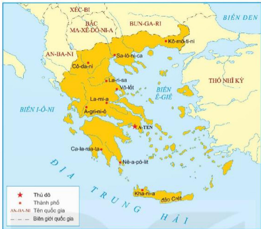
▲ Hình 2. Lược đồ Hy Lạp ngày nay