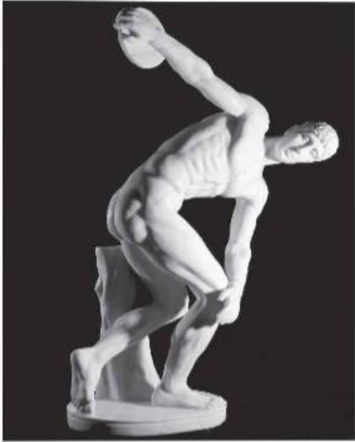
▲ Hình 4. Tượng lực sĩ ném đĩa

Tượng lực sĩ ném đĩa đĩa: là một bức tượng kinh điển của nghệ thuật tạc tượng Hy Lạp cổ đại, hiện nay được trưng bày trong Viện Bảo tàng Anh ở Luân Đôn. Vận động viên đang thực hiện động tác ném đĩa với một dáng vẻ hoàn hảo. Cơ bắp và biểu hiện tập trung tạo ra ấn tượng như một mũi tên đang căng trên dây cung trước khi được bắn ra.