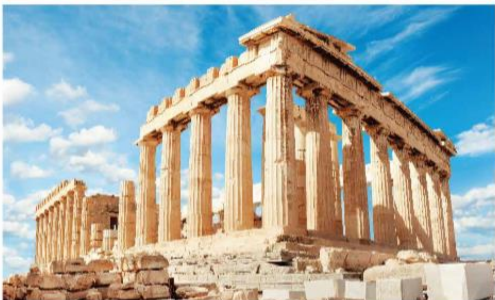
▲ Hình 3. Đền Pác-tê-nông

Đền Pác-tê-nông: được xây dựng trên đồi A-crô-pôn (Acropole) vào thế kỉ V TCN. Đền được xây dựng bằng đá cẩm thạch trắng, mái được đỡ bởi các cột tròn ở bốn mặt. Bên trong đền có một phòng lớn, phía trước đặt tượng thờ nữ thần A-tê-na cao 6 m, được chế tác từ vàng và ngà voi.