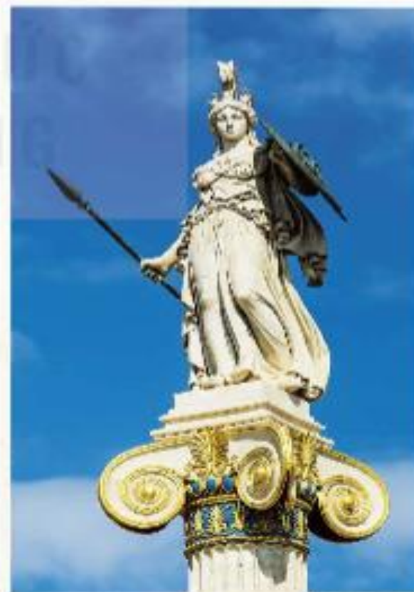
▲ Hình 5. Tượng thần A-tê-na (Hy Lạp)

(Theo Nguyễn Văn Khoa, Thần thoại Hy Lạp , NXB Văn học, 2022)