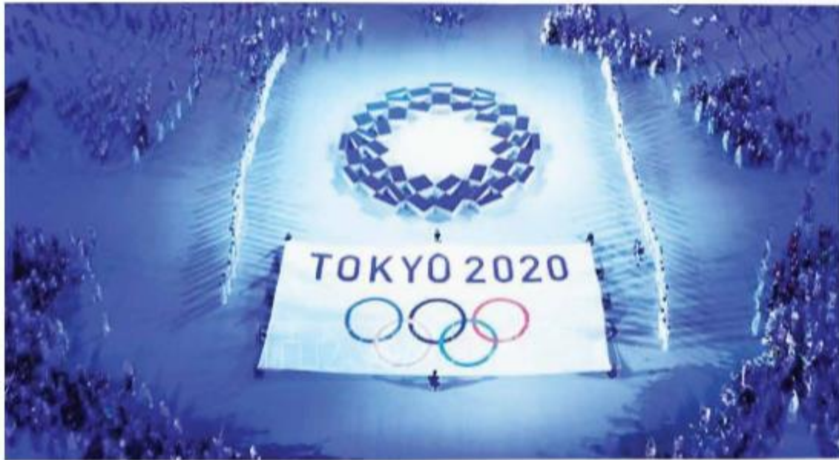
▲ Hình 2. Lễ khai mạc Ô-lim-píc Tô-ki-ô (Nhật Bản) năm 2020