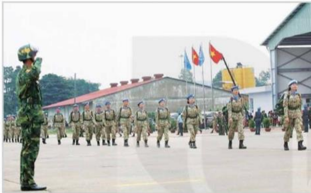
▲ Hình 3. Quân nhân Việt Nam lên đường làm nhiệm vụ tại Phái bộ Gìn giữ hoà bình của Liên hợp quốc ở Nam Xu-đăng