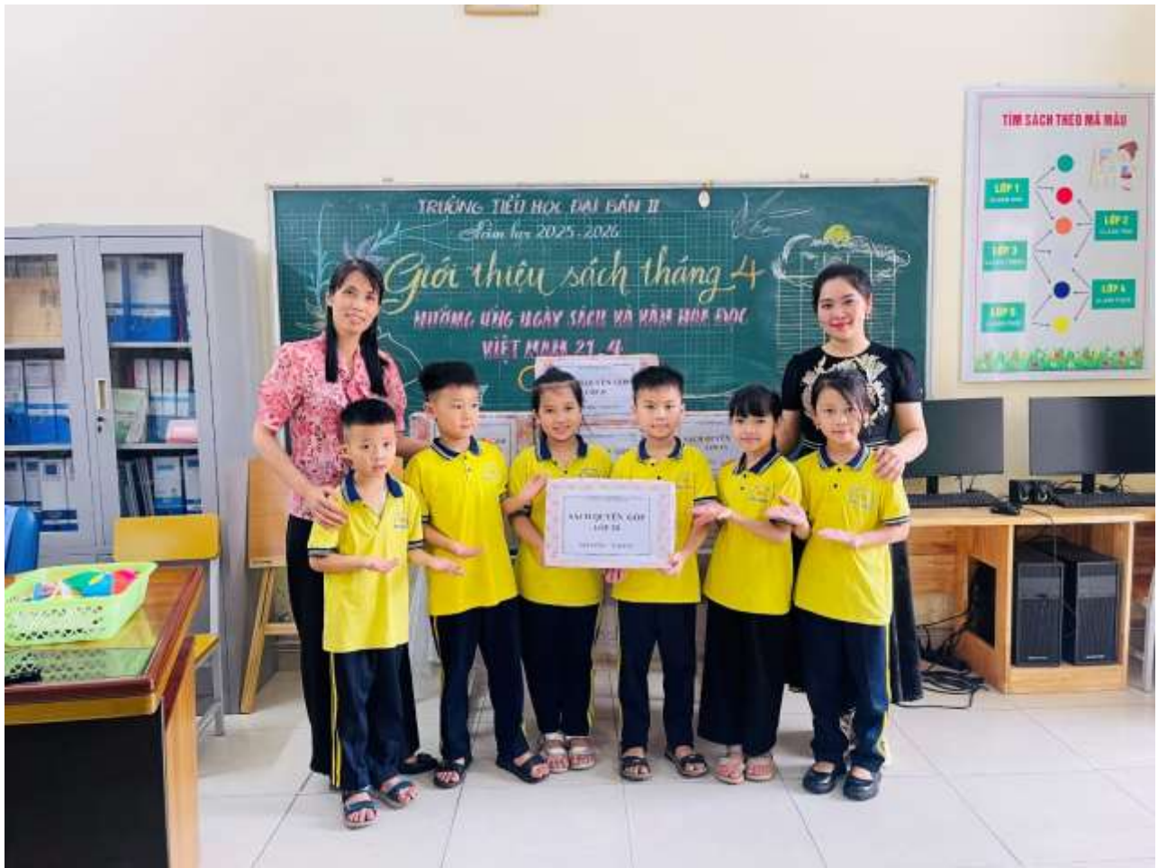
Học sinh và giáo viên quyên góp sách