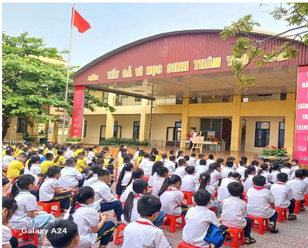
Học sinh giới thiệu sách trong giờ chào cờ