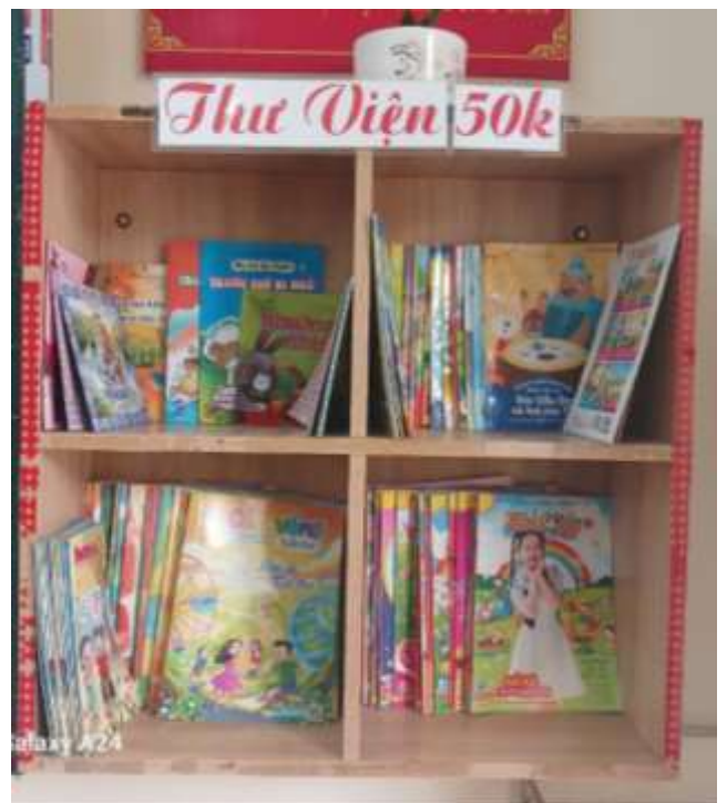
Góc thư viện lớp được trang trí đẹp