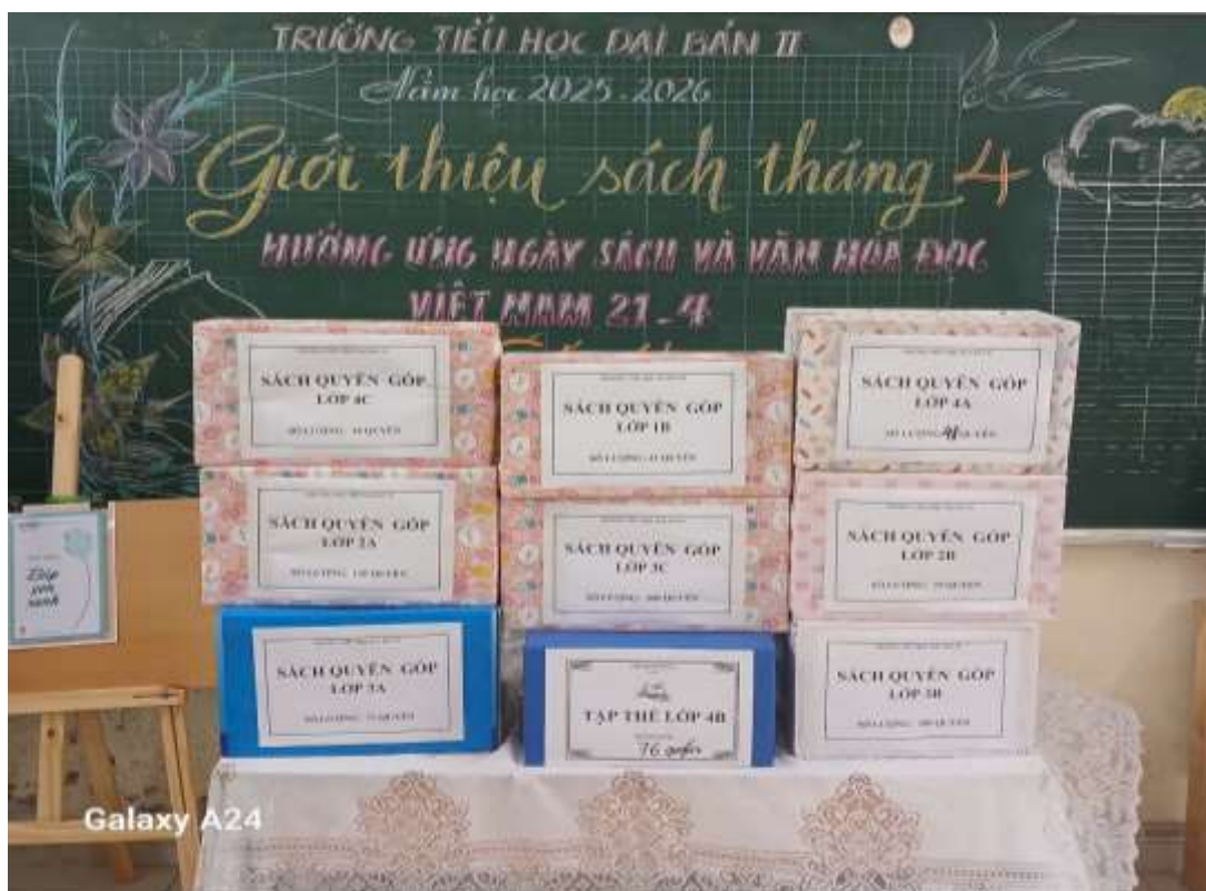
Học sinh và giáo viên quyên góp sách