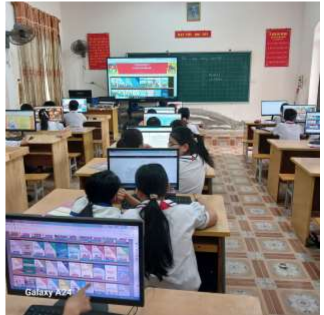
Học sinh đọc sách báo qua phần mềm thư viện Vietbiblio