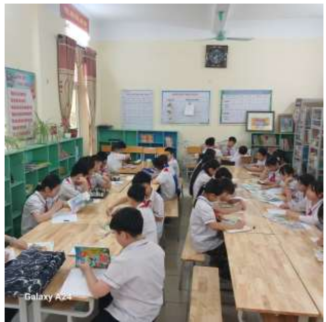
Học sinh đọc sách tại thư viện