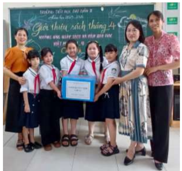
Học sinh và giáo viên quyên góp sách