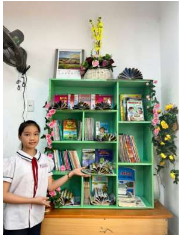
Góc thư viện lớp được trang trí đẹp