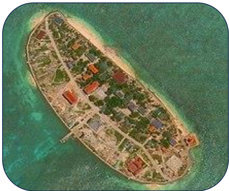
Đảo Sơn Ca