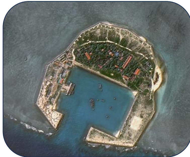
Đảo Sinh Tồn