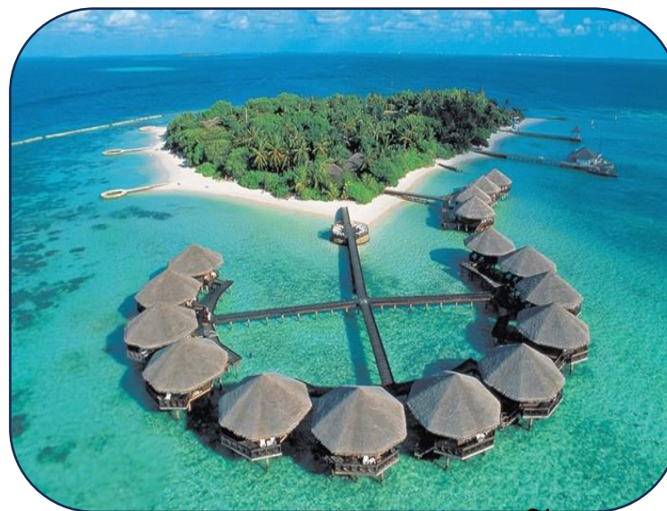
Đảo Vĩnh Viễn