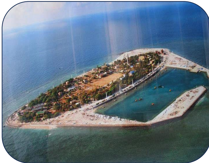
Đảo Song Tử