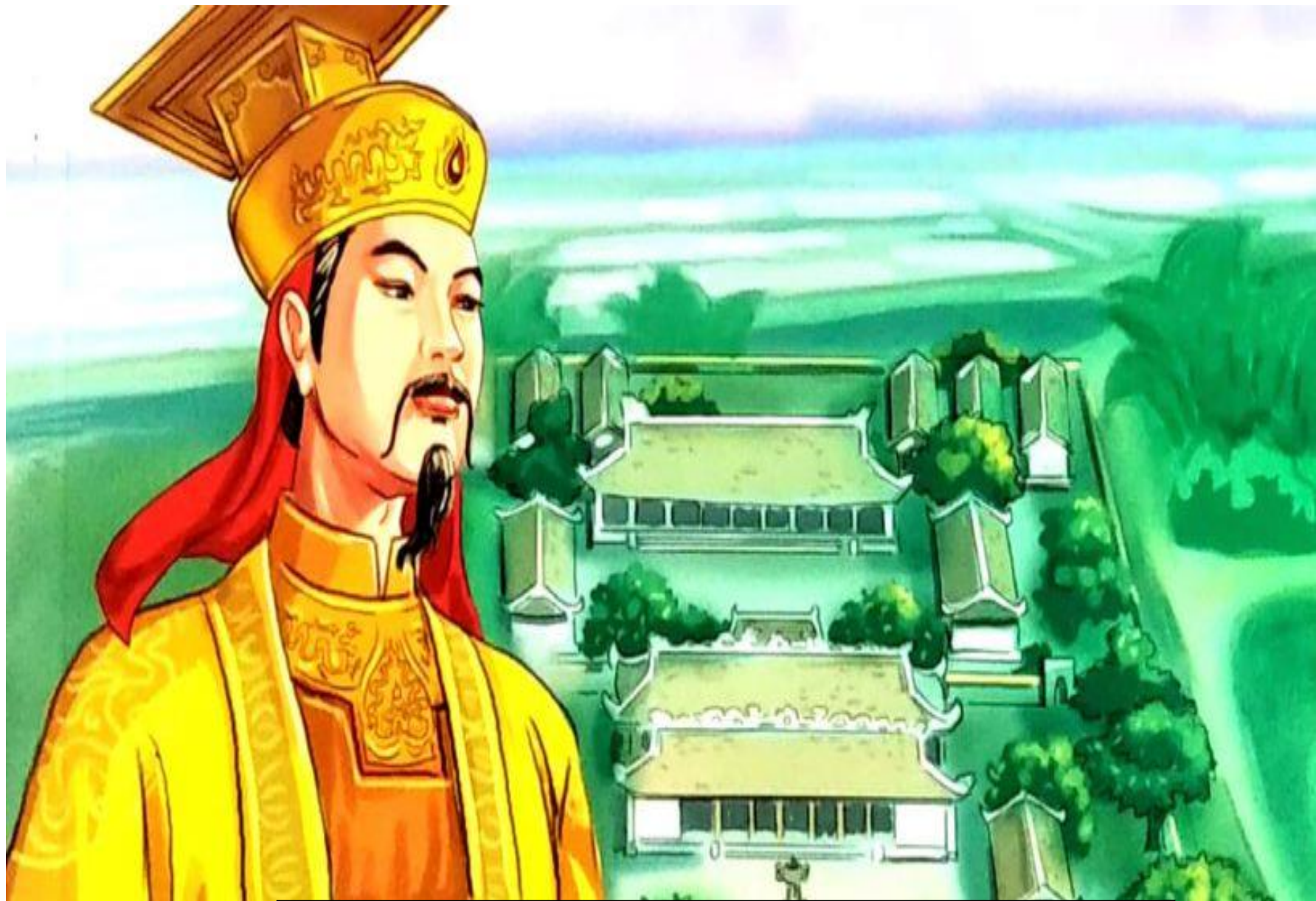
Lý Thánh Tông (1023 – 1072)