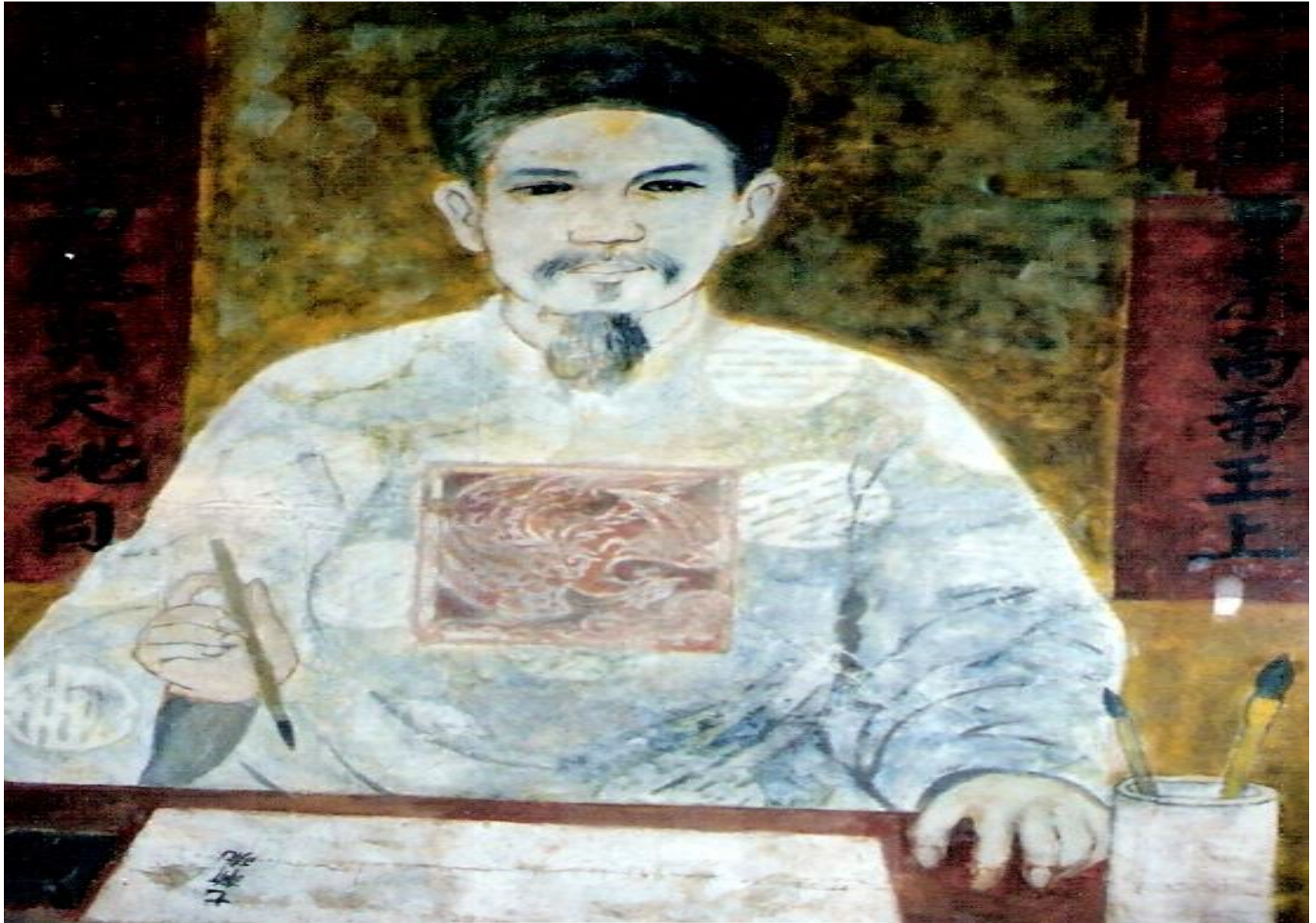
Chu Văn An