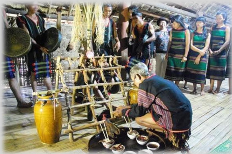
Lễ cúng Cơm mưa đầu mùa

Hoạt động tái hiện các nghi lễ truyền thống