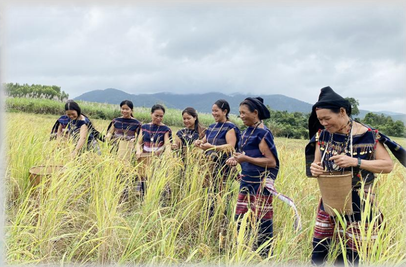
Lễ Mừng lúa mới