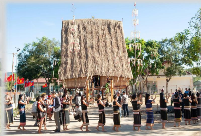
Lễ Mừng nhà rông mới