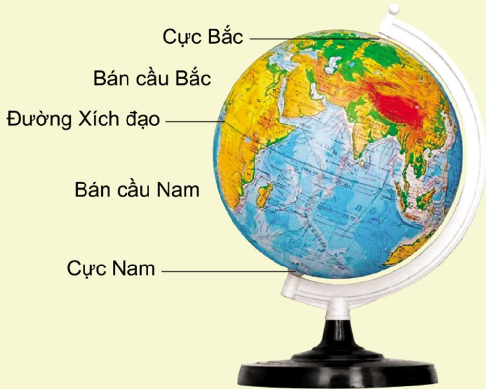
Quả địa cầu

☞ Trái đất nằm trong không gian vũ trụ và có dạng hình cầu.